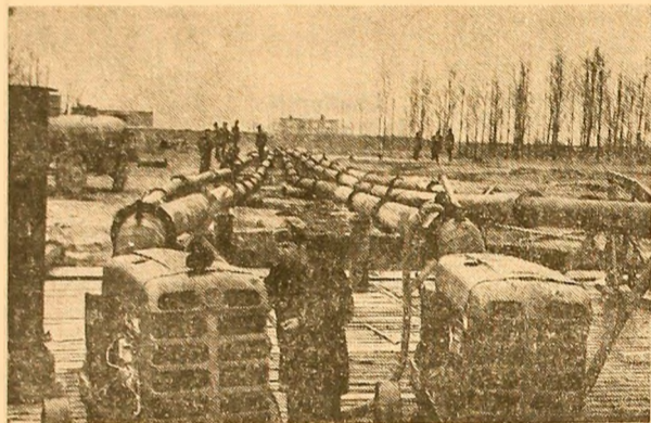
Și ieri, stațiile de pompare montate pe molul Borcei au trimis sute de mii de metri cubi de apă în canale pentru irigațiile culturilor