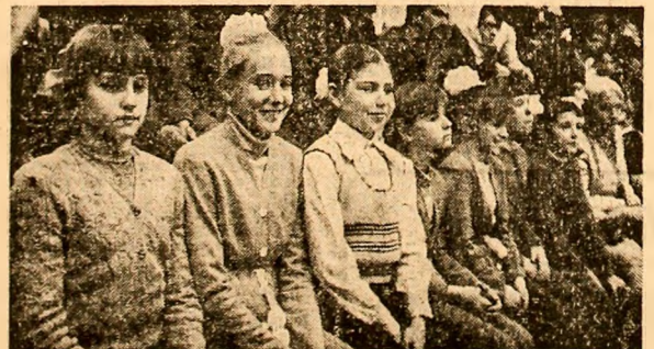
În tribună, privind la exercițiile mamestrelor: Nadia Comăneci (prima din stînga) și micile ei colege din generația „marilor speranțe”