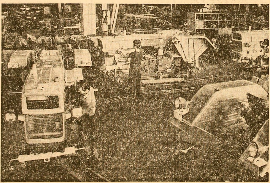
Intreprinderea de tractoare Brașov. Aspect din secția asamblare