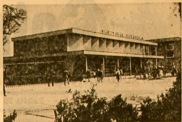
Noul complex meșteșugărească din Pașcani