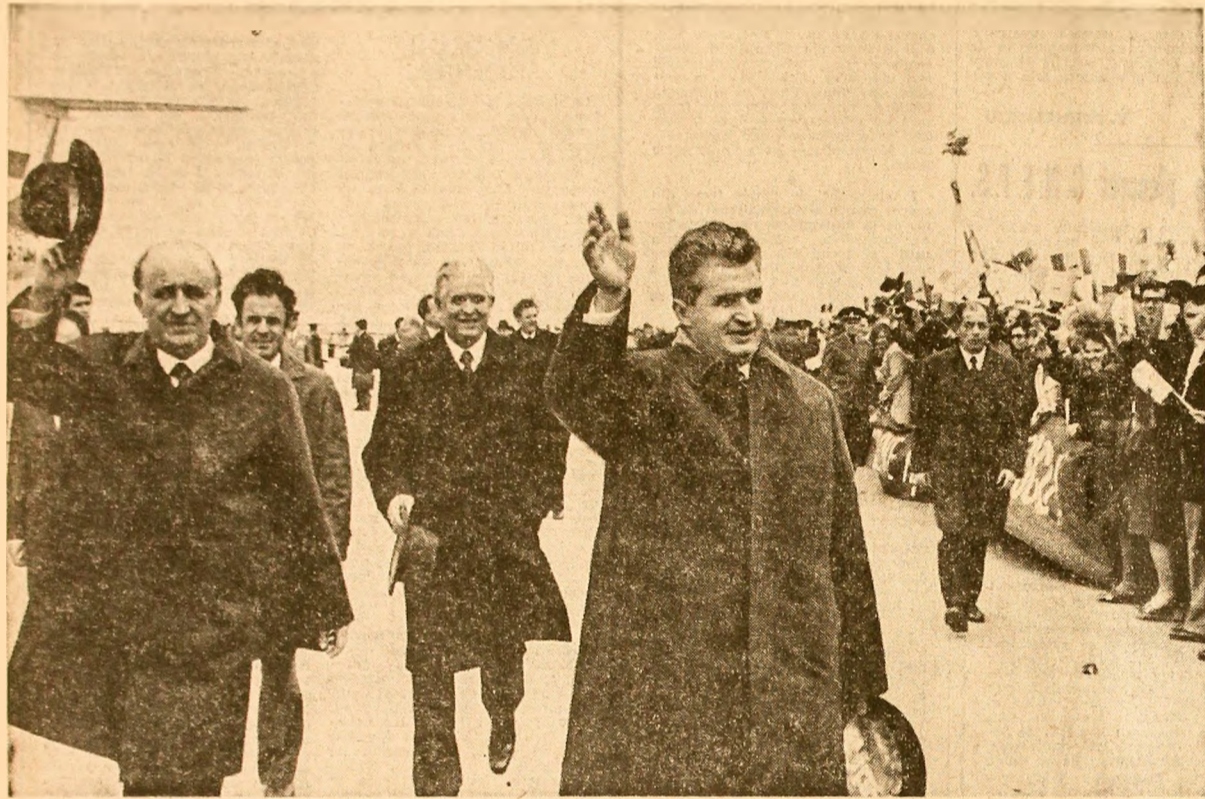
Pe aeroportul din Varna