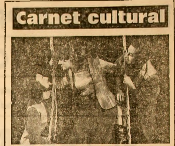
Scenă din spectacolul pe care Teatrul „Bacovia” din Bacău le-a prezentat în microstagionul sa bucureștean. Regia: Dușan Mihailovici din R. S. F. Iugoslaviei

FOTBAL: Programul etapei a XXVIII-a Campionatul categoriei A de fotbal programază astăzi o nouă etapă. În Capitală, pe stadionul „23 August”, se vor desfășura în cuplaj următoarele întâlniri: Rapid — F.C. Petrolul (ora 17.00) și Sportul studentesc — U.T.A. (ora 18.45). În alte locuri, în cuplaj, ale etapei a XXVIII-a: F.C. Constanța — Sport Club Bacău; F.C. Argeș — Steaua; C.S.M. Reșița — Politehnica Iași; Universitatea Craiova — A.S.A.; Politehnica Timișoara — C.F.R.; Jui — Steaua roșu; Universitatea Cluj — Dinamo. În cadrul emisiunii de radio „Sport și muzică” se vor transmite aspecte de la toate întîlnirilor. Transmisia se va face pe programul I, cu începere din jurul orei 16.45. De asemenea, amatori de sport vor putea urmări de la orele 20.15, tot pe programul I, aspecte din ultima parte a meciului Sportul studentesc — U.T.A.