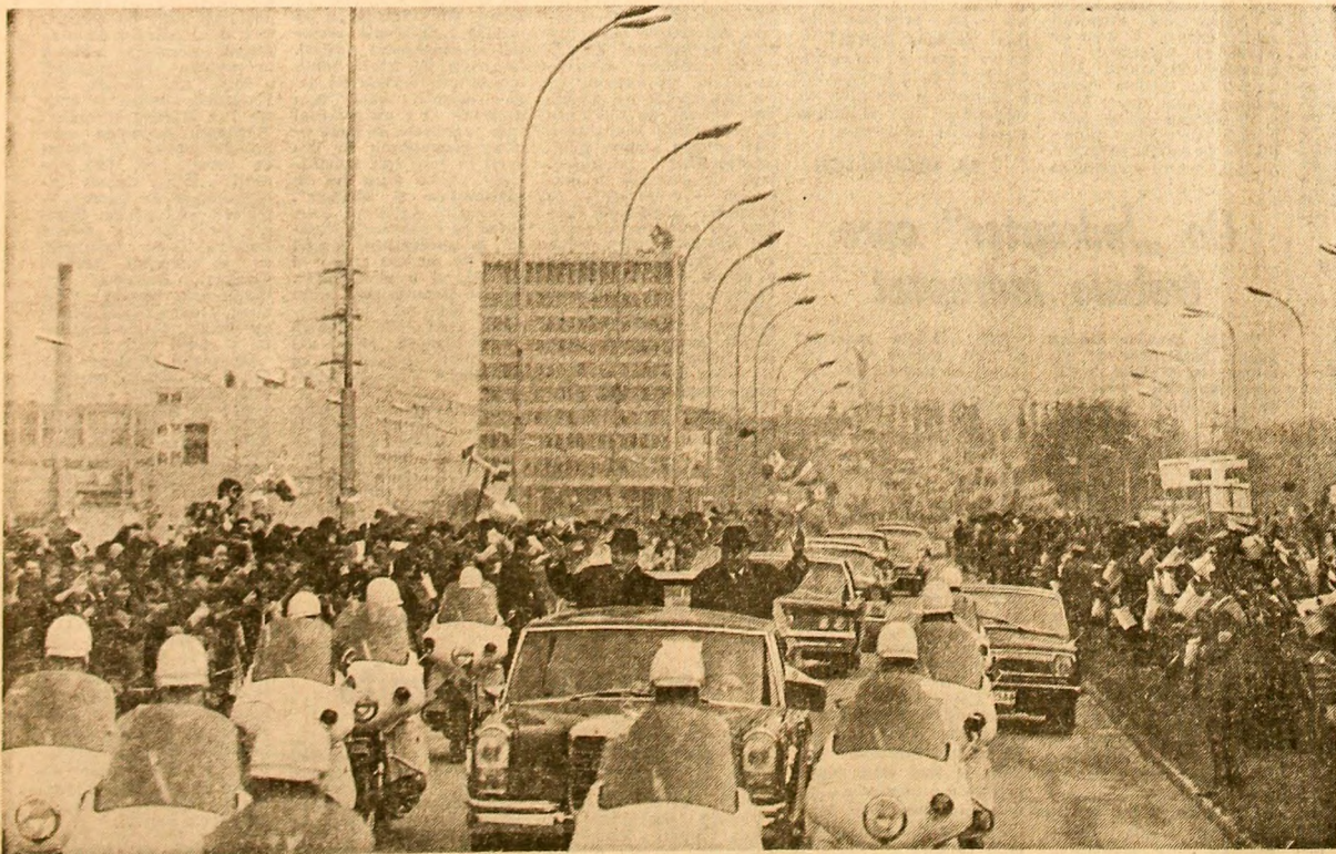
Locuitorii Varnai manifestează cu însuflețire pentru prietenia româno-bulgară

Un angajament ferm în marea întrecere socialistă: