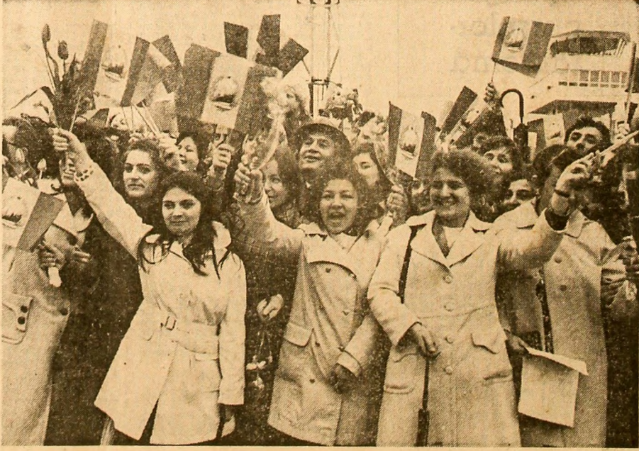
Pe tot traseul vizitei, populația a făcut o primire entuziastă tovarășului Nicolae Ceaușescu