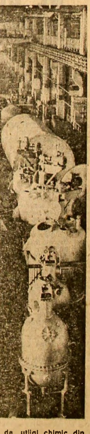
Întreprinderea de utilaj chimic din Capitală: Un nou lot de produse la standul de probe

BRĂILA (Correspondentul „Științei”, Valeriu Stoiu). — În această primăvară patrimoniul horticol al județului Brăila s-a îmbogățit cu o nouă mare lemă organizată în fermă pomicolă aparținînd întreprinderii de legume și fructe. La Căznuș, pe 158 ha au fost plantați peste 63 000 de coși, pierci, cireși, vișini, pruni etc. Fermă dispune de mijloacele mecanizate cunvenite: tractoare, discuri, mașini de siropid etc. Alături de noua livadă se află pe rod o mare plantărie de căpsuni cu o suprafață de 30 hectare.