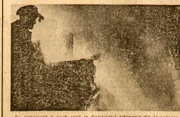
Se elaborează o nouă șarjă la Combinatul siderurgic din Hunedoara

BUZĂU (Correspondentul „Științei”, Mihai Băzu). — După primele 4 luni din acest an, colectivul de muncă al grupului de sanuzerie pentru construcții industriale a muncitorului Buzău a raportat îndeplinirea planului de construcții-montaj în proporție de 115 la sută, ceea ce reprezintă 35,8 la sută din volumul de lucru cuprins în planul anual de producție. „Această