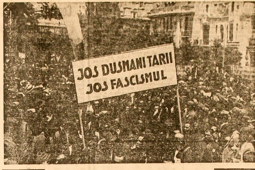
O imagine din presa vremii, frecvent în acea „primăvară fierbinte” a anului 1936: mase largi de cetățeni, din cele mai diferite categorii sociale, își exprimau, prin puternice intruniri și manifestații de stradă, voința de a se împotrivi fascismului, de a lupta pentru apărarea democrației, a independenței și suveranității naționale. Aspecte de la marea demonstrație cetățenească din Capitală de la 31 mai 1936