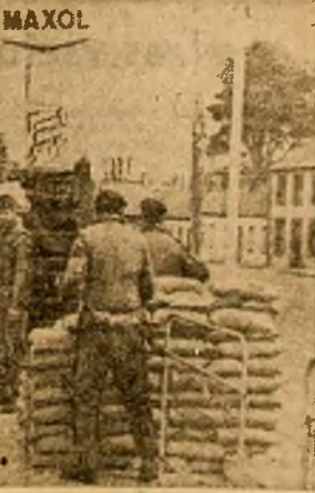
Din Londra se anunță că dezbaterile din Camera Comunelor asupra situației din Irlanda de Nord s-au încheiat fără a se fi adoptat vreo hotărâre...