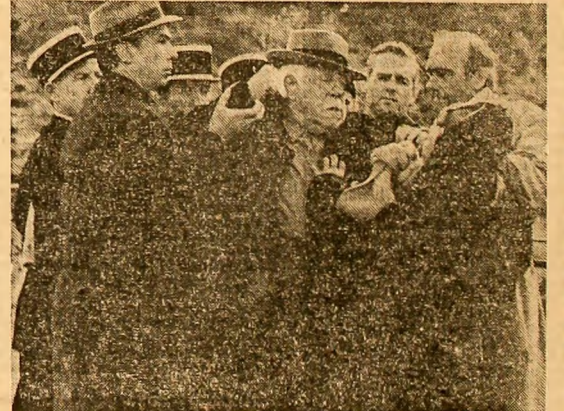
Coproducție franco-italo-spaniolă. Regia: Claude Bernard-Aubert. O remarcabilă reconstituire a unui proces celebru din Franța anilor '50.