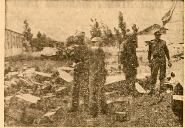
Membri ai unităților de observatori ai O.N.U. în zona tampon dintre forțele siriene și cele israeliene