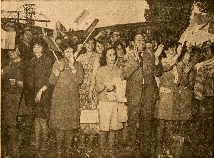
Primire plină de căldură, entuziasă la întreprinderea pentru mecanizarea construcțiilor industriale

● LA TOT PASUL, UN EXEMPLU BUN ● ASISTENȚA MEDICALĂ A OAMENILOR MUNCII VENIȚI LA TRATAMENT ● NU E RENTABIL SĂ PRIVESTI CERUL CIND AI PLOAIA... LA ROBINET PAGINA A II-A