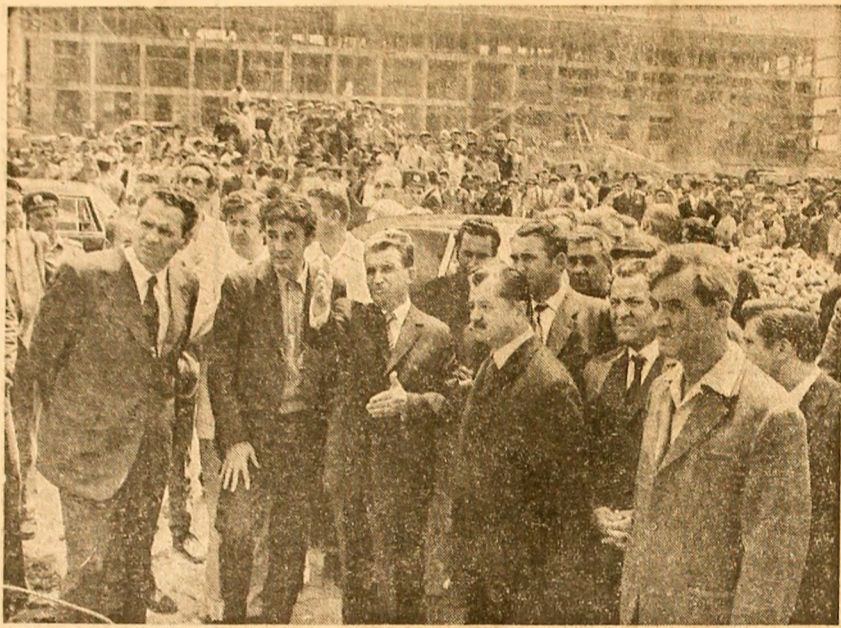
Marele șantier din Dealul Piscului. Analiză concretă a stadiului lucrărilor, indicații prețioase pentru constructori