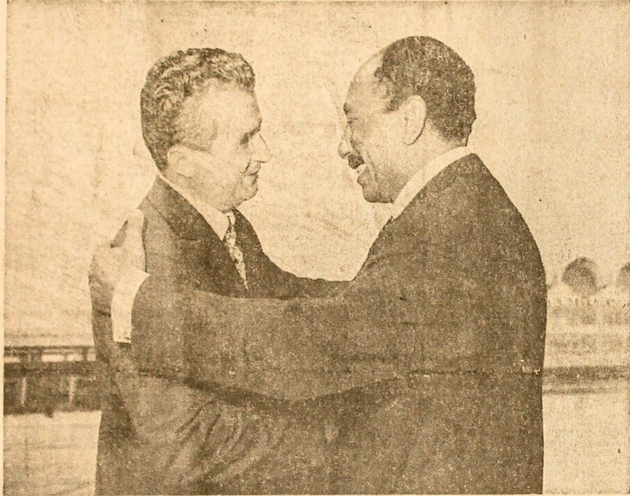
Revedere cordială, pe aeroportul Otopeni

După vizita oficială întreprinsă de șeful statului român, în aprilie 1973, în Republica Arabă Egipt, care a deschis o etapă salubrită superioară în dezvoltarea legăturilor de prietenie tradiționale dintre cele două țări și popoare, un alt moment de seamă are loc în planul relațiilor bilaterale. Șeful statului român, care o face în acest sens, începând de la 27 iunie, președintele Republicii Arabe Egipt, Mohammed Anwar El Sadat, împreună cu soția doamna Gihane El Sadat, la invitația președintelui Republicii Socialiste România, Nicolae Ceaușescu, și a tovarășei Elena Ceaușescu. Noua întâlnire la nivel înalt româno-egiptean, este caracterizată de o deosebită atmosferă de optimism și bună înțelegere. Atenția marcată față de acest eveniment este largi implicări pozitive în domeniul oportunităților reciproce, precum și în sfera intereselor internaționale, care, evident, temerari profunde, este fiind astăzi de program subliniate de președintele Nicolae Ceaușescu în interviul acordat recent agenției egiptene M.R.N. „Asesăm că vizita președintelui Sadat în România a constituit un moment important în evăduirea viitoare a colaborării economice, tehnico-scientifice, culturale între țările noastre, și în general a colaborării în lupta pentru înfruntarea unei politici noi, bazată pe egalitate, pe respect al independenței și neamestec în