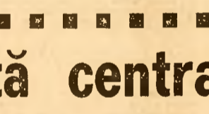
Lucerna, cea mai valoroasă plantă furajeră, se bucură de multă atenție din partea cooperanților...