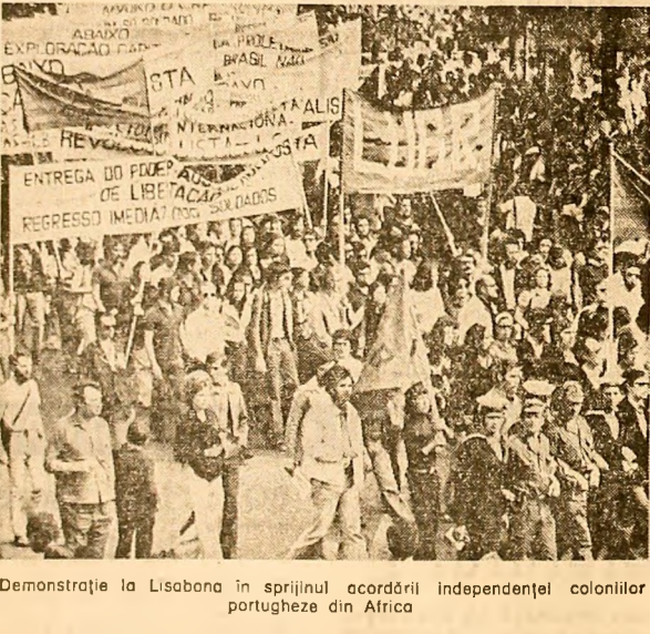
Demonstrație la Lisabona în sprijinul acordului independenței coloniilor portugheze din Africa