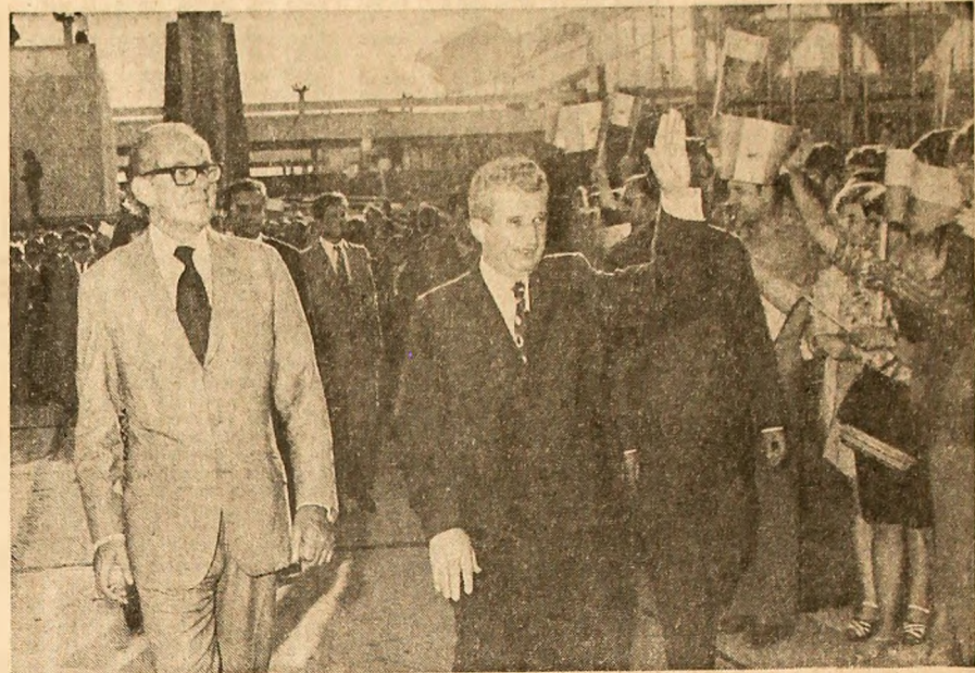
Aspecte de la plecarea de pe aeroportul Otopeni.

Convorbirile, întrevederile cu președintele Nicolae Ceaușescu au pus puternic în evidență dorința comună de a deschide relațiilor de prietenie și colaborare româno-columbiene noi și rodnice orizonturi, în interesul reciproc, al cauzei păcii și înțelegerii internaționale