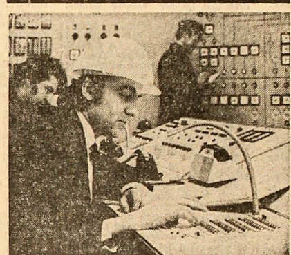
La termocentrala Rogojelu, în sala de comandă