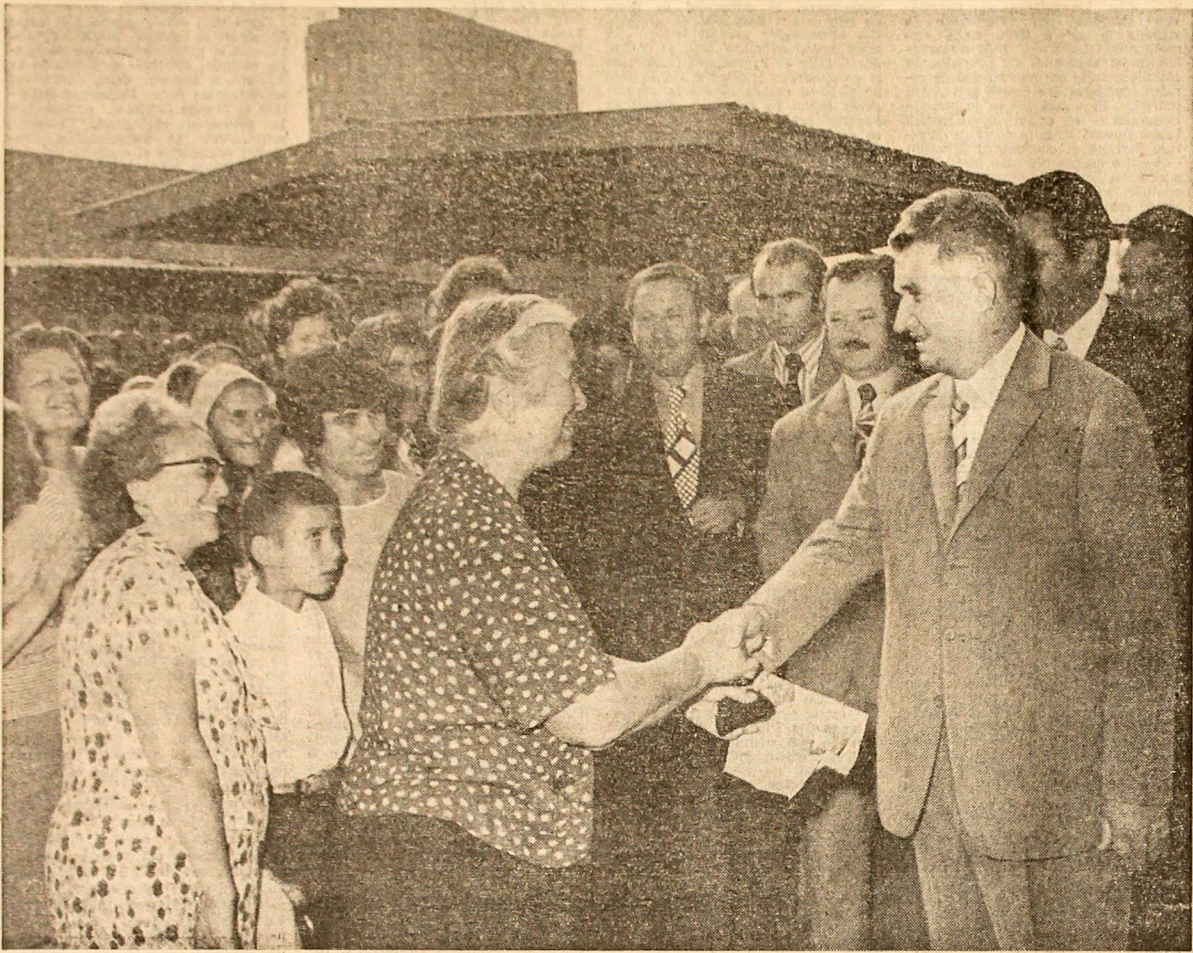
Pretulidenți, manifestări de stimă și dragoste