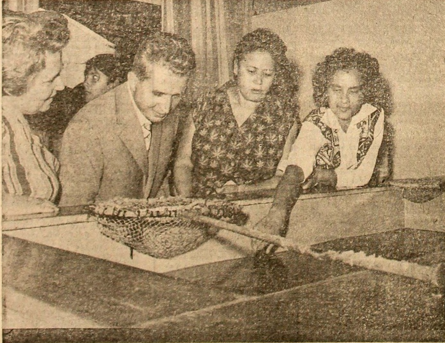
Aspect al vizitei în Hala Traian

*) Ulterior, la data de 19 iulie a.c., s-a publicat legea Consiliului de Stat al Portugaliai prin care se recunoștea dreptul la independență al popoarelor din fostele colonii portugheze — N.R.