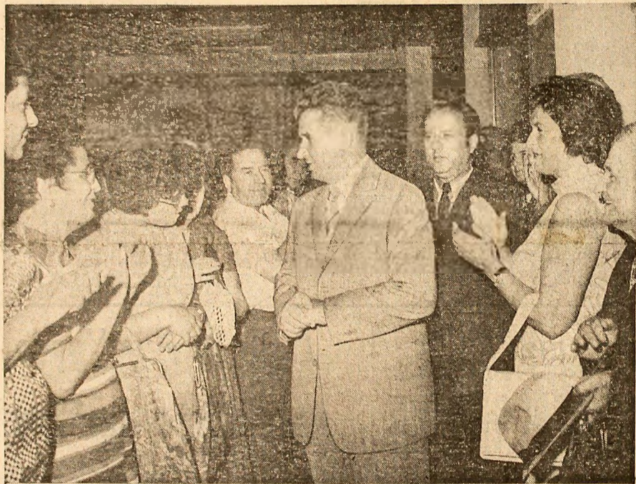
De vorbă cu gospodine, în Piața Amzei

Dorobanți. Complet renovată, ea cunoaște o deosebită animație, o mare afinență de cumpărători. După vizita precedentă a secretarului general al partidului, gospodarii orașului au luat măsuri pentru a realiza indicațiile date vizind modernizarea acestui important vad comercial. Este un centru de desfacere reorganizat aproape în întregime. Aici a fost inaugurat, recent, un complex comercial.