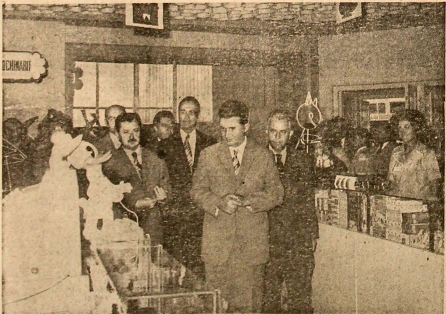
La noul magazin „Materna”

Astăzi, în jurul orei 9,30, studioul de televiziune va transmite în direct de la complexul expozițional din Piața Șcînteii ceremonia deschiderii oficiale a celei de-a 3-a ediții a Expoziției realizărilor economice naționale.