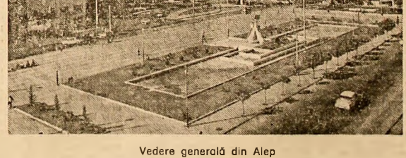
Vedere generală din Alep