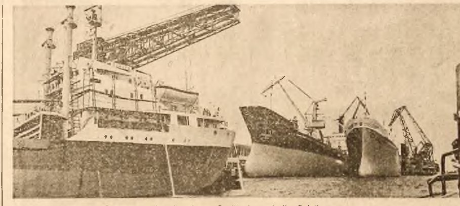
Imagine de pe Șantierul naval din Galați