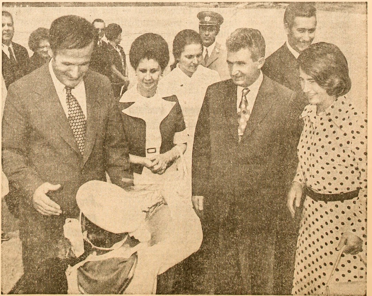
Flori pentru președintele prieten al Siriei

La invitația tovarășului Nicolae Ceaușescu, președintelui Republicii Socialiste România, și a tovarășei Elena Ceaușescu, președintele Republicii Liberia, dr. William R. Tolbert jr., împreună cu soția, doamna Victoria Tolbert, va face o vizită oficială în România, începând cu data de 10 septembrie a.c.