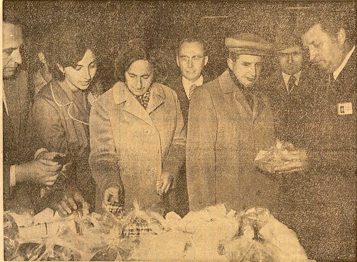
La întreprinderea de textile nețesute „Nettex” sint prezentate cîteva din sortimentele noi