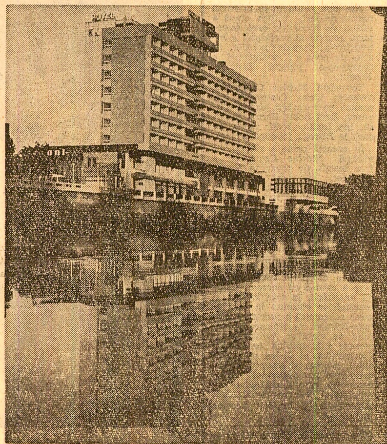
Hotelul „Dacia” din Oradea