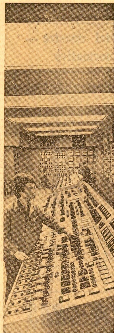
Pupitru de comandă al termocentralei Grozvești din Capitală

Există toate posibilitățile ca — fructificînd experiența reușitelor certe de pînă acum și trăgînd învățăminte din deficiențele apărute pe parcurs — activitatea de control obștesc să-și sporească în continuare altă eficiență practică în soluționarea efectivă a unor probleme sociale, în îmbunătățirea permanentă a condițiilor de trai și de muncă ale populației, cit și eficiența educativă (ca factor care dezvoltă conștiința și competența profesională, din toate păturile sociale — conștiința datoriei de a controla și interveni, ca factor profilactic în prevenirea unor abateri sau neajunsuri). Este nevoie însă de o concentrare a eforturilor pe care le fac în acest domeniu — sub conducerea organizațiilor de partid — consiliile locale ale F.U.S., sindicatele, organizațiile U.T.C., comitetele și comisiile femeilor și uniunilor cooperatiste — toate organizațiile făcînd parte din Frontul Unității Socialiste, căruia, așa cum se precizează în proiectul Programului partidului, îi revin sarcini importante în organizarea controlului obștesc — formă democratică de participare a maselor la perfecționarea activității publice, de creștere a spiritului de răspundere în soluționarea problemelor sociale, în îmbunătățirea condițiilor de muncă și viață ale întregului popor.