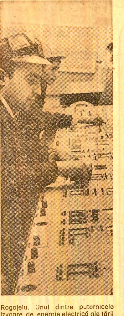
Rogojelu. Unul dintre puternicele izvoare de energie electrică ale țării