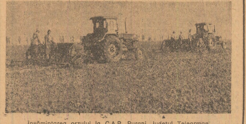
Însămînțarea orzului la C.A.P. Purani, județul Teleorman