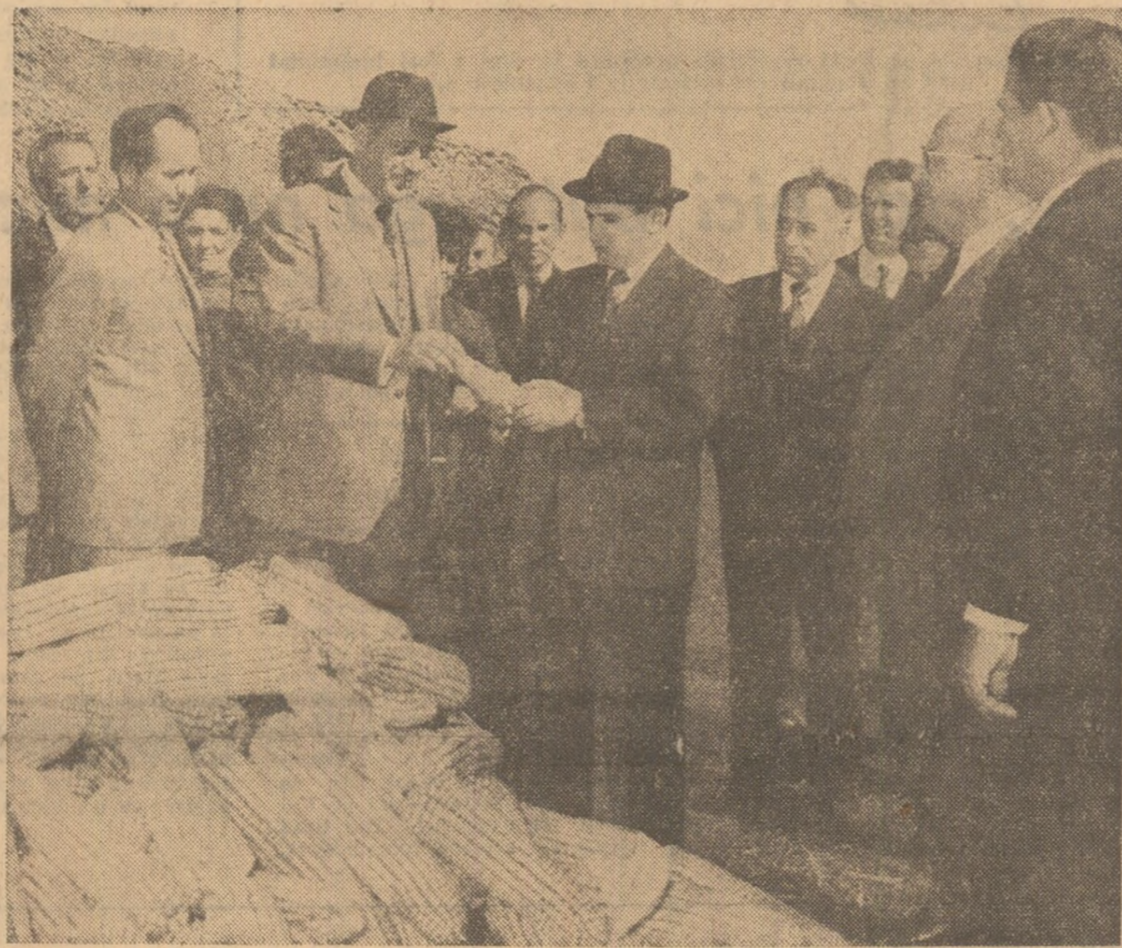
Dialog despre producția de porumb actuală și viitoare

● Secretarul general al partidului a felicitat pe cooperatorii de la Scornicești și Izbiceni, a adresat întregii țărâni îndemnul de a munci cu hărnicie, de a face totul pentru buna desfășurare a lucrărilor agricole din această toamnă, pentru a obține recolte și mai mari în anii ce vin.