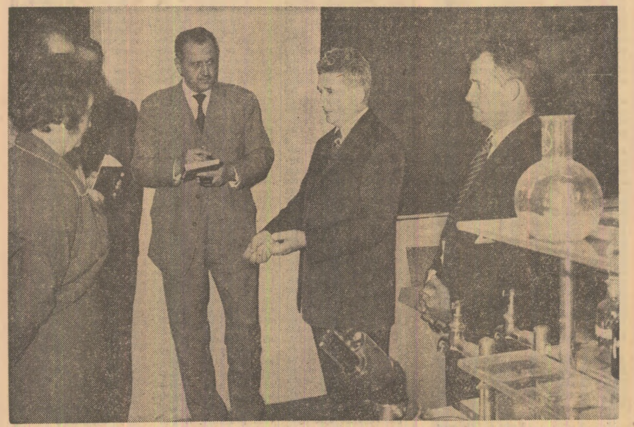
Vizitînd laboratorul liceului din Scorniceşti