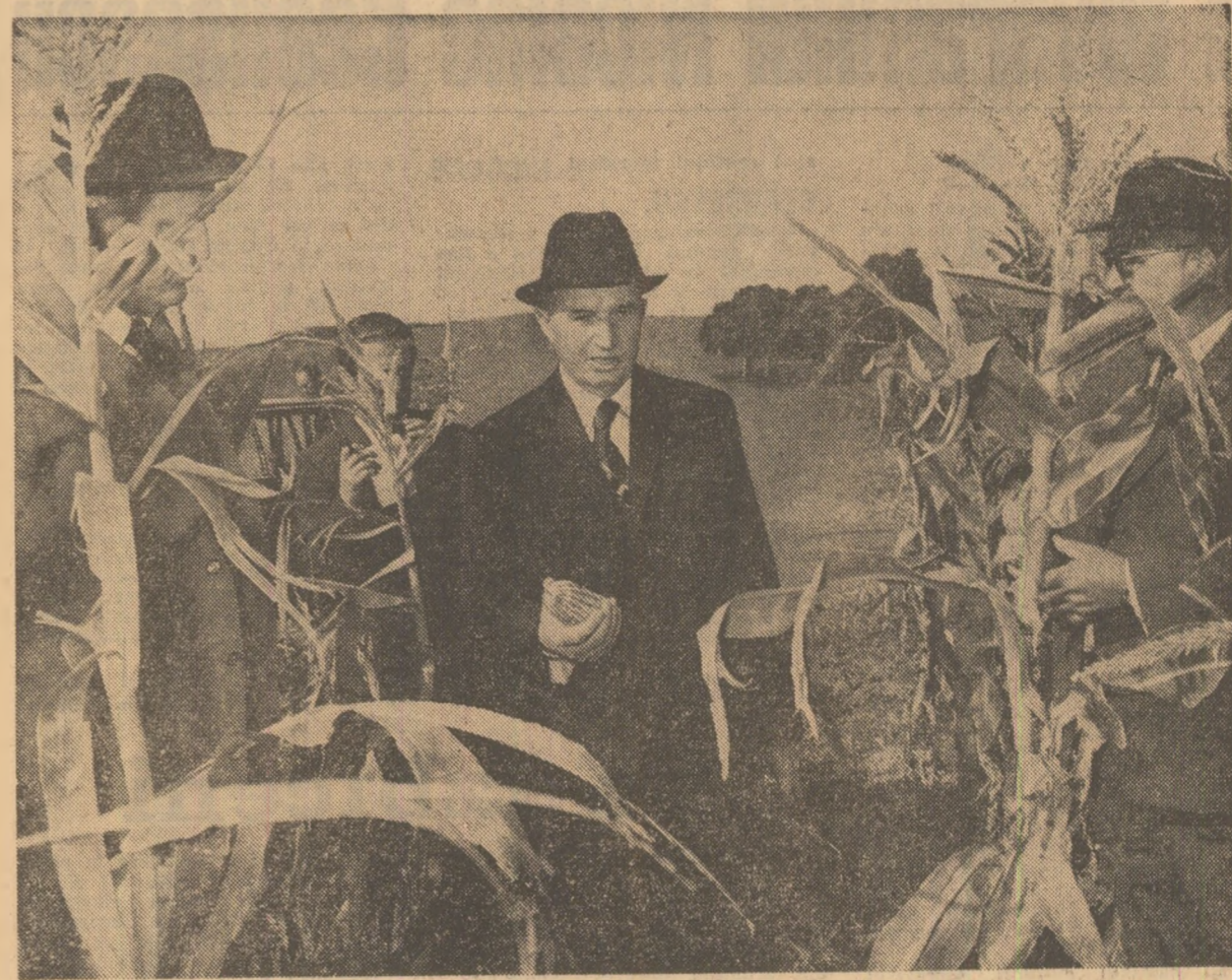
Secretarul general al partidului s-a oprit în repetate rînduri în lanurile de porumb ale cooperativei agricole din Scorniceşti

Vă doresc multă sănătate şi multă fericire! (Aplauze puternice; urale; se scandează: „Ceauşescu — P.C.R.”). Cel prezenţi la adunare ovaţionează Indeleul pentru Partidul Comunist Român, pentru Comitetul Central, pentru secretarul general al partidului, tovarăşul Nicolae Ceauşescu).