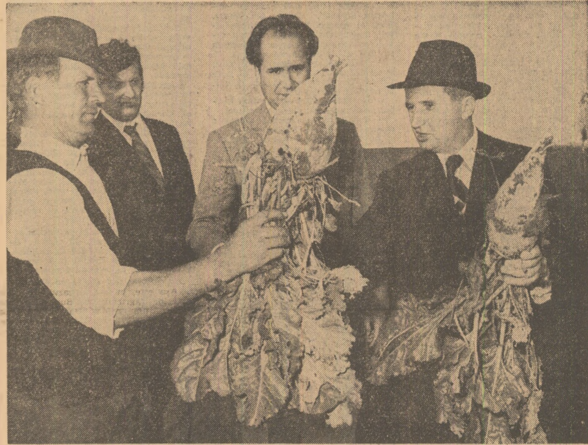
Pe taralele cultivate cu sfeclă de zahăr ale cooperativelor din Izbiceni