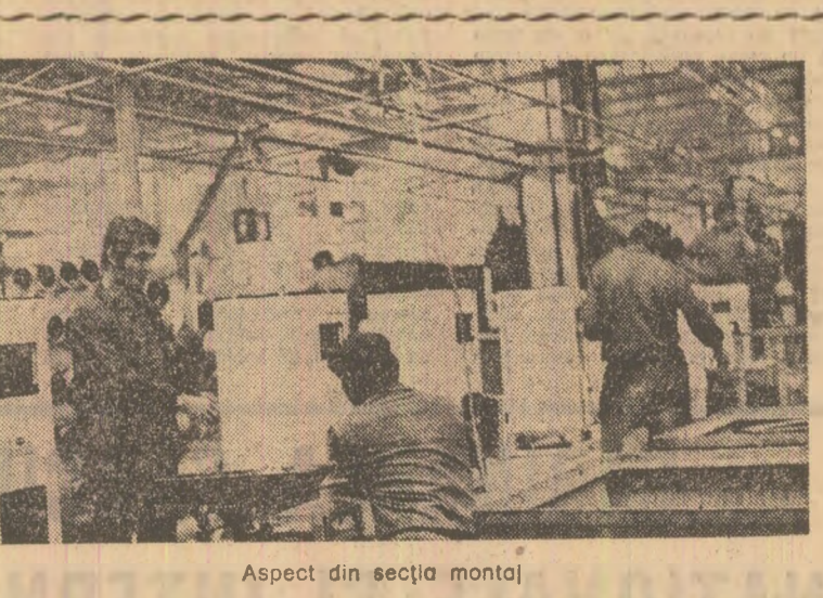
Aspect din secția montaj

SATU-MARE (Correspondentul „Scintei“, Octav Grumeza). — Colectivul întreprinderii „23 August“ din Satu-Mare și-a îndeplinit exemplar sarcinile pe patru ani la cincinalului. Încă de la data de 5 septembrie, dată de la care se realizează, pînă la sfîrșitul anului, producția suplimentară de 152 milioane lei. În contextul realizării acestui harnic colectiv merită relevate și economiile de metal care, în 8 luni din acest an, se ridică la 120 tone, existînd toate premisele ca angajamentul anual de