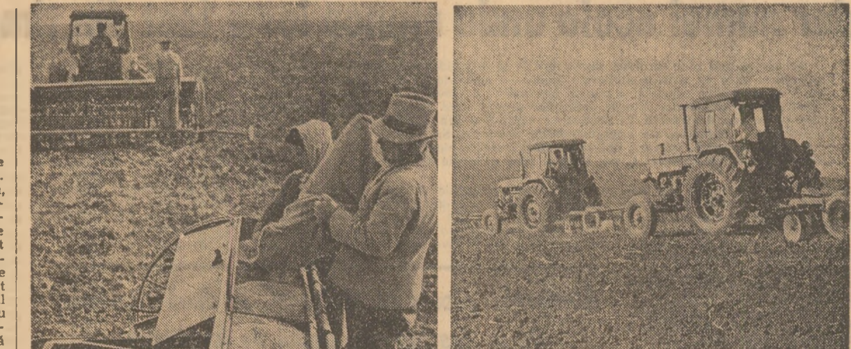
Zile de muncă intensă pentru asigurarea viitoare recolte. La semănat, pe ogoarele cooperativei agricole Mărgineni, județul Olt (fotografia din stînga), și la pregătirea terenului la cea din Mirzănești, județul Teleorman (fotografia din dreapta)

Agadur, „Incurcături în familie“ pentru că aici nu mai poate fi vorba de greutăți, de neînțelegeri din partea altor departamente. Din moment ce s-au întocmit repartițiile, s-a dat și un ordin care, așa cum s-a văzut, conține prevederi ferme în această direcție, trebuia urmărit din timp modul cum se desfășoară acțiunea. Trebuie luate măsuri energice ca problema semințelor să fie rezolvată în timpul cel mai scurt, astfel încît însemnările să se poată desfășura în condiții normale.