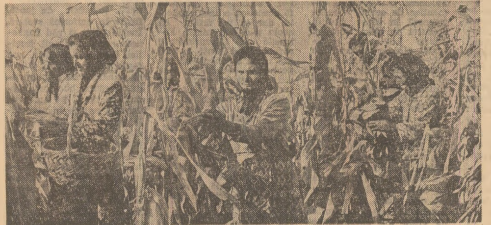
La culesul porumbului pe ogoarele cooperativei agricole din Scornicești-Olt.

Floarea-soarelui a fost strînsă de pe 96 la sută din suprafețele cultivate în întreprinderile agricole de stat și 93 la sută în cooperativele agricole. În 10 județe ale țării această lucrare s-a încheiat. Aici, întreaga recoltă este pusă la adăpost. În continuare sînt necesare eforturi susținute pentru ca și în județele Bacău, Neamț și Caraș-Severin,