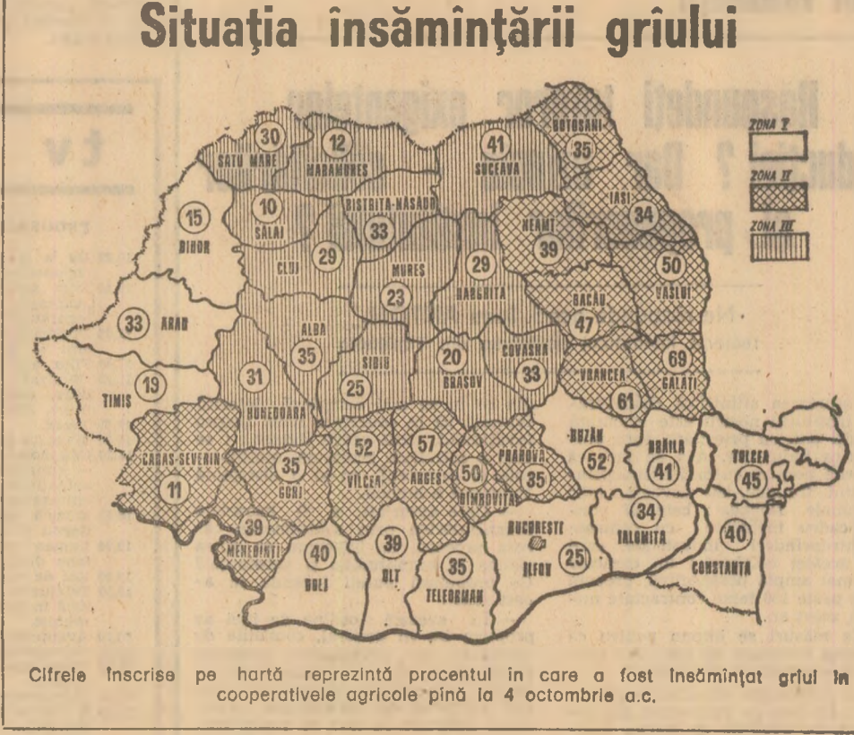
Cifrele înscrise pe hartă reprezintă procentul în care a fost însămînțat grîul în cooperativele agricole pînă la 4 octombrie a.c.