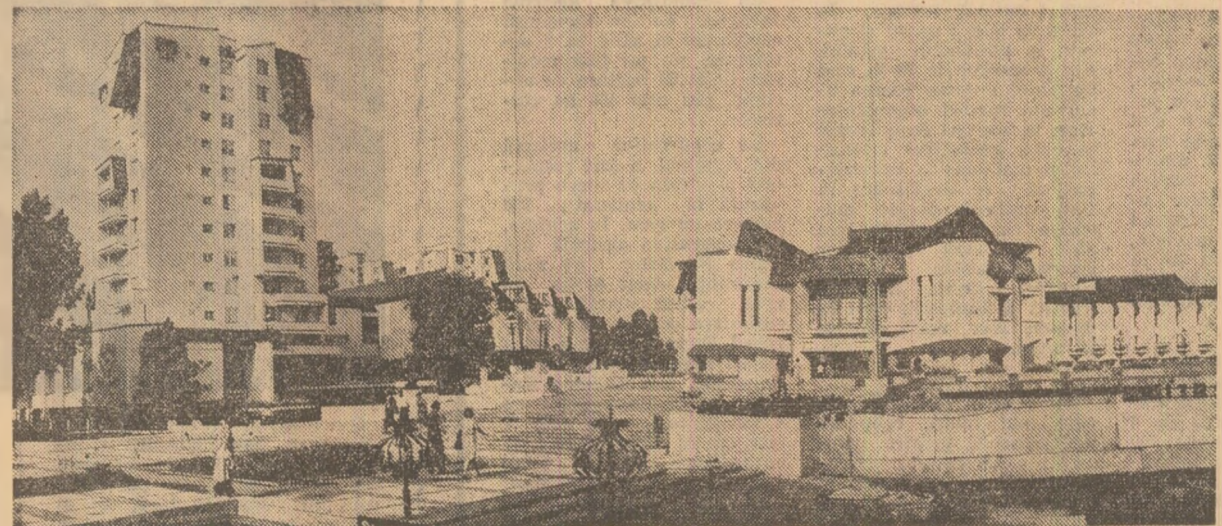
Din noua arhitectură a orașului Tg. Mureș