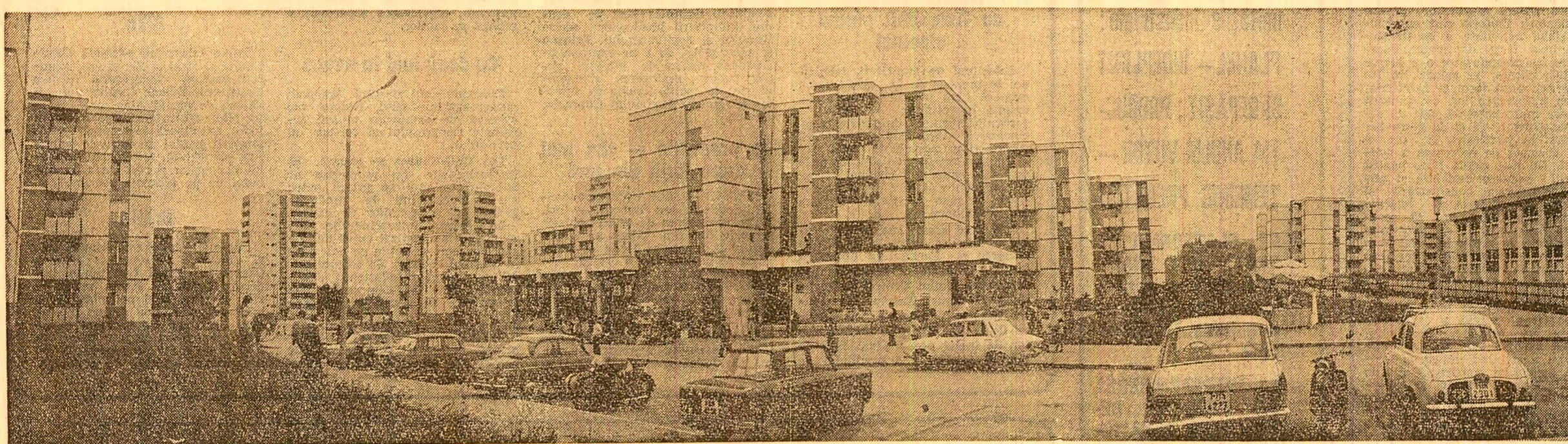
Vederea dintr-un nou cartier de locuințe din Tirgu-Mureș

Desfăcerea legumelor și fructelor. În comuna Rimet, județul Alba — localitate de munte, unde asemenea produse nu pot fi cultivate — ar fi necesară înființarea unui chioșc pentru desfăcerea legumelor și fructelor. În această scutură cetățenii de cheltuieli suplimentare cu deplasările pe distanța de 25 km pînă la Aiud. Demersurile făcute pînă în prezent au fost cîștigate, în sensul de a se reînființa stația „Privighetorii” din apropierea Pieței 30 Decembrie. În acest fel s-ar veni în împlinirea cerințelor îndreptățite ale sutelor de locuitori care, în cadrul „Vaporului”, (Ioan Fl. Brânzaș, str. Romană 7, Oradea).