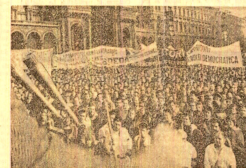
ITALIA. Amplă manifestație în centrul orașului Milano, în sprînjul revendicărilor oamenilor muncii

Cunoscutul interpret Laurence Olivier a anunțat că, în 1976, va pune în scenă la Teatrul Metropolitan din New York opera „Macbeth” a lui W. G. Verdi. Spectacolul va fi prezentat în cadrul manifestărilor prilejuite de cea de-a 200-a aniversare a proclamării independenței S.U.A. Va fi debutul regional al lui Olivier care, în viitor, intenționează să cultive și acest gen al artei.