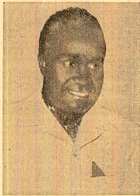
dr. Kenneth David Kaunda obține, alături de Congresul Național African, majoritatea în Consiliul Legislativ al teritoriului.

La invitația tovarășului Nicolae Ceaușescu, secretar general al Partidului Comunist Român, președintele Republicii Socialiste România, și a tovarășii Elena Ceaușescu, miine sosește la București dr. Kenneth David Kaunda, în țara noastră.