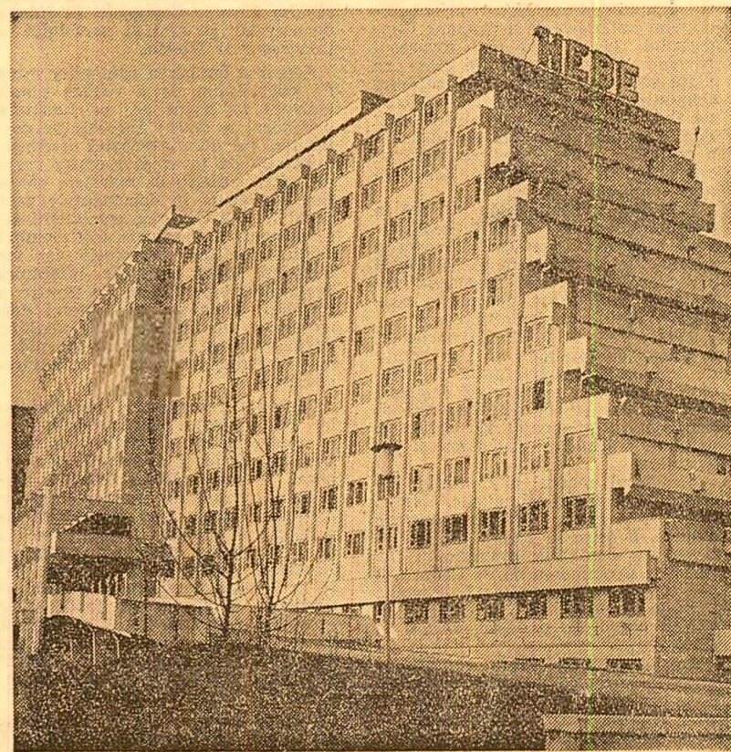
Hotelul balnear Hebe din Singeorz

George MIHAESCU corespondenții „Științei”