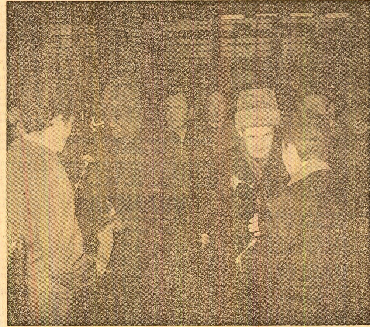
Primire caldă, prietenească, la întreprinderea „Semănătoarea”

Azi, transmisiuni directe la radio și televiziune: — În jurul orei 11, solemnitatea semnării documentelor oficiale româno-zambiene; — În jurul orei 14, ceremonia plecării președintelui Partidului Unit al Independenței Naționale, președintele Republicii Zambia, dr. Kenneth David Kaunda, și a doamnei Betty Kaunda.