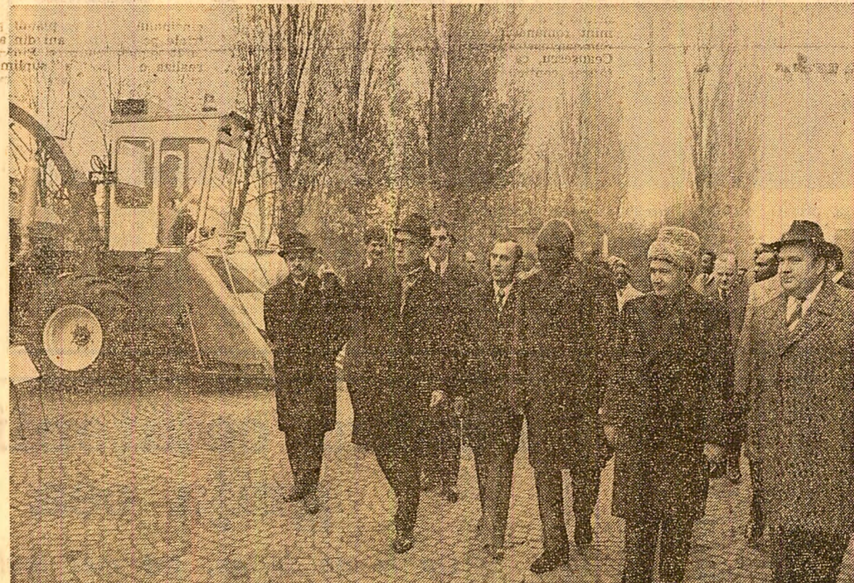
Înălți oaspeți în vizită la întreprinderea „Semănătoarea”