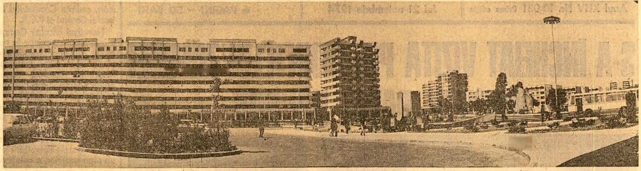
CRAIOVA '74 (Imagine din Piața Gării)

— Încercăm să încheiem aici teleconferința de azi. Din celelalte județe continuăm să primim vestii despre realizările de prestigiu pe care numeroase alte colective le închină Congresului partidului, realizări care constituie tot atâtea argumente pentru certitudinea înfăptuirii viitoare.