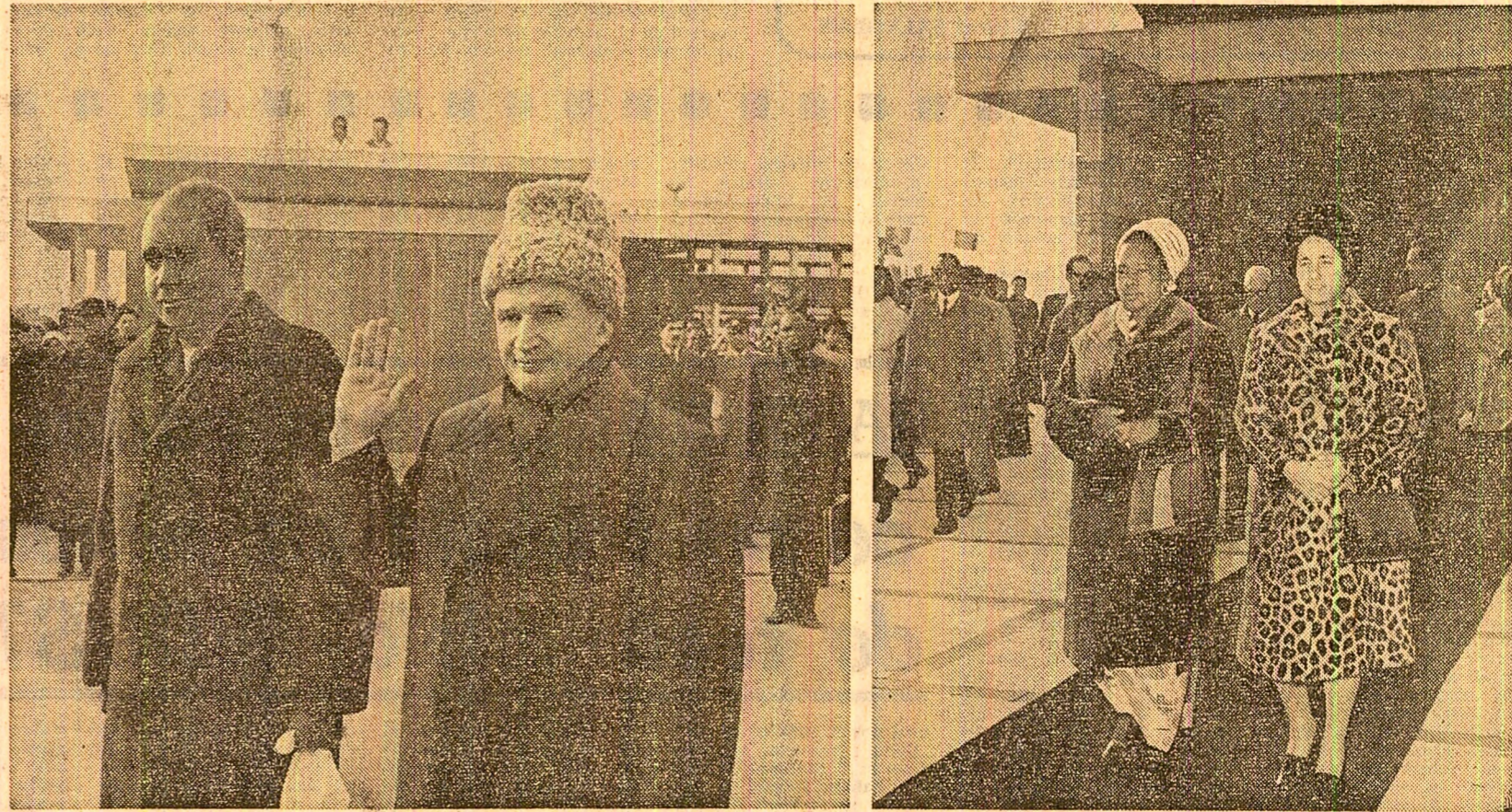
La plecare, pe aeroportul Otopeni

• Încheierea convorbirilor la nivel înalt româno-zambiene • Comunicatul comun