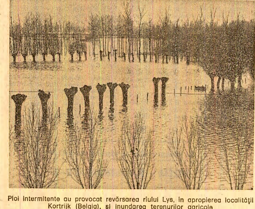
Ploi intermitente au provocat revărsarea râului Lys, în apropierea localității Kortrijk (Belgia), și inundarea terenurilor agricole

Cînd în sala de judecată, unde urma să se desfășoare ultima sesiune a unui proces de expulzare a țărărilor din Forros da Almada, s-a anunțat stingerea acțiunii, ca urmare a prevederilor noului decret-lege privind arandarea pămînturilor necultivate, cei peste 200 de țărani aflați de față au izbucnit în urale. Forros da Almada este o mare moșie din zona Ribatejo, aparținînd unei proprietăți absenteiste, așa cum este cazul cu majoritatea proprietăților de acest gen din regiune. De multă vreme, încă înainte de actuala proprietate, moșia era cultivată în arandă de către țărani, care, prin eforturile și sudoarea lor, au transformat terenuri neproductive și pietroase în pămînt fertil. De cîteva generații pe acele pămînturi trăiau și munceau 48 de familii, în condiții de totală incertitudine, depinzînd de clauzele vînturilor contract, care puteau fi schimbate după bunul plac al proprietarului. Mult timp arandă a fost plătită în producție, recoltate, procentul acestora crescînd continuu. Apoi, proprietatea a decăzut ca prela arandă și se făcî în bani, fiind însă un preț mult pes-