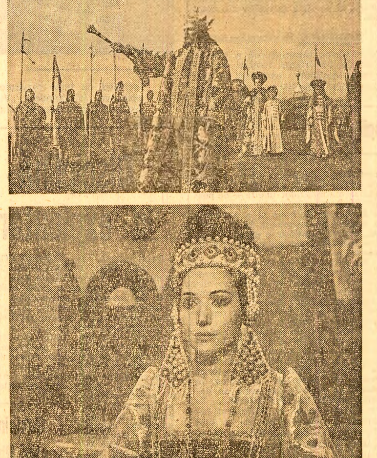
SCENARIUL: Constantin Miru, Mircea Drăgan; REGIA: Mircea Drăgan. IMAGINIA: Mircea Mladu; MUZICA: Theodor Grigoriu...