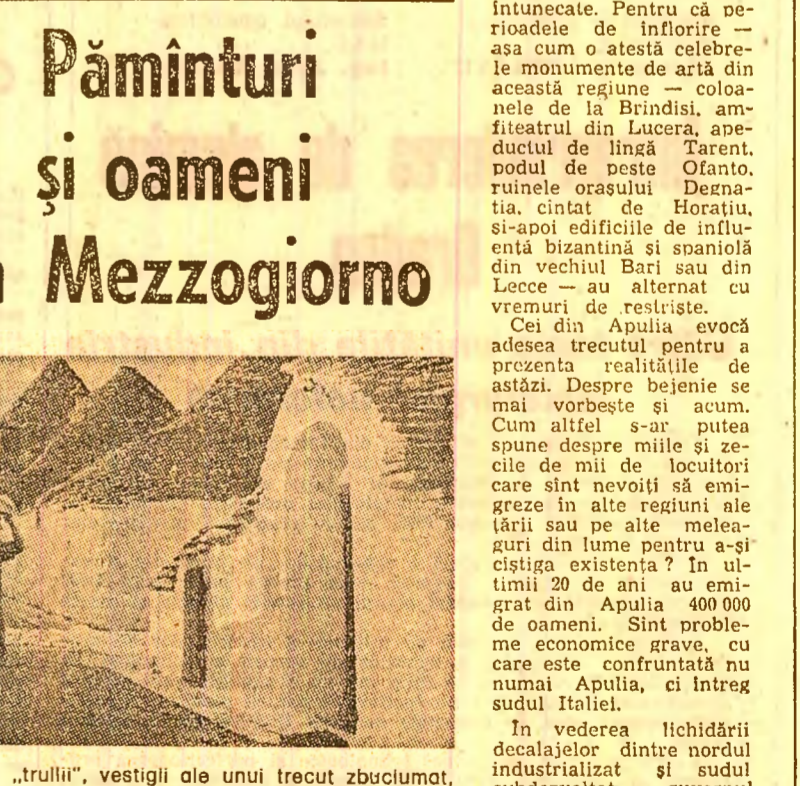
Pitoarele „trulli”, vestigiile ale unui trecut zbuciumat, s-au păstrat cel mai bine în orașul Alberobello, din Apulia