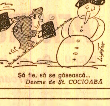
Să fie, să se gîndească... Desene de ȘT. COCIOABA

teatre Teatrul Național București (sala mare) - 19.30. Teatrul Mic - Matea - 19.30.