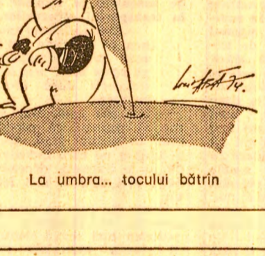
La umbra... tocului bătrîn