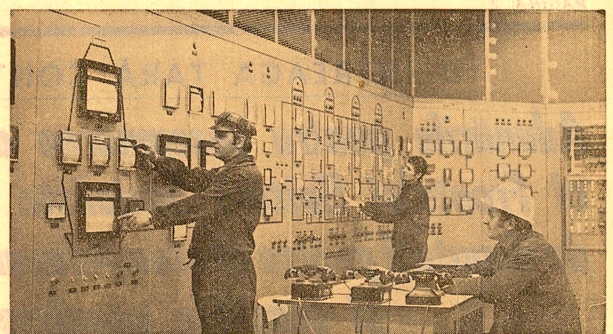
Colectivul Combinatului siderurgic din Hunedoara a produs de la începutul anului și pînă acum importante cantități de metal peste prevederi. În fotografie: sala de comandă a furnalului nr. 9

MEHEDIŢI • În municipiul Drobeta Turnu-Severin, în orașele Orșova, Strehaia și în alte localități urbane din Mehediții se află în studii avansate de execuție mai mult de jumătate din cele 1 750 de apartamente ce se vor da în anul acesta în folosință.