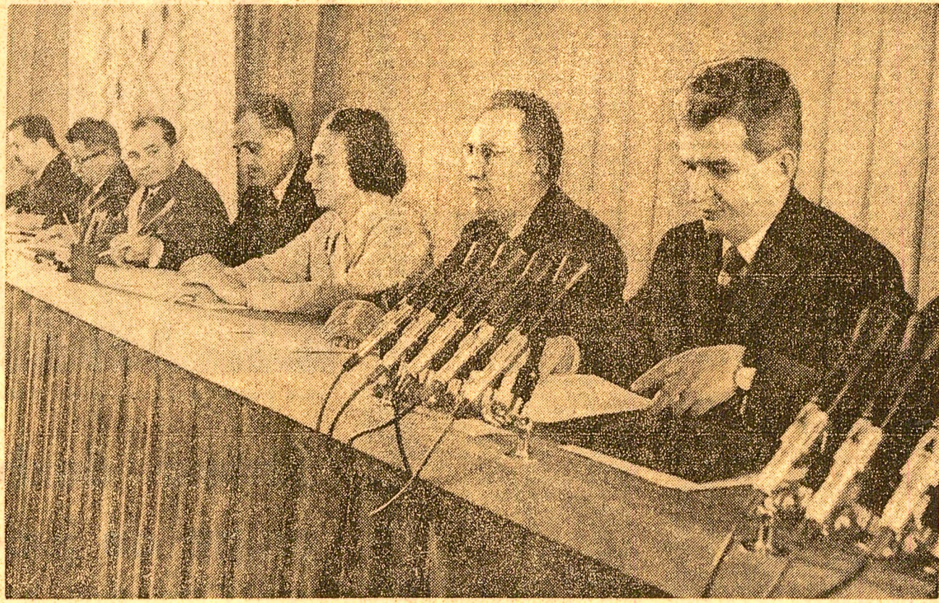
Aspect din timpul lucrărilor

Ieri s-a încheiat Consfătuirea activului de partid și de stat din agricultură, din cercetarea științifică agricolă, din domeniul îmbunătățirilor funciare și din piscicultură