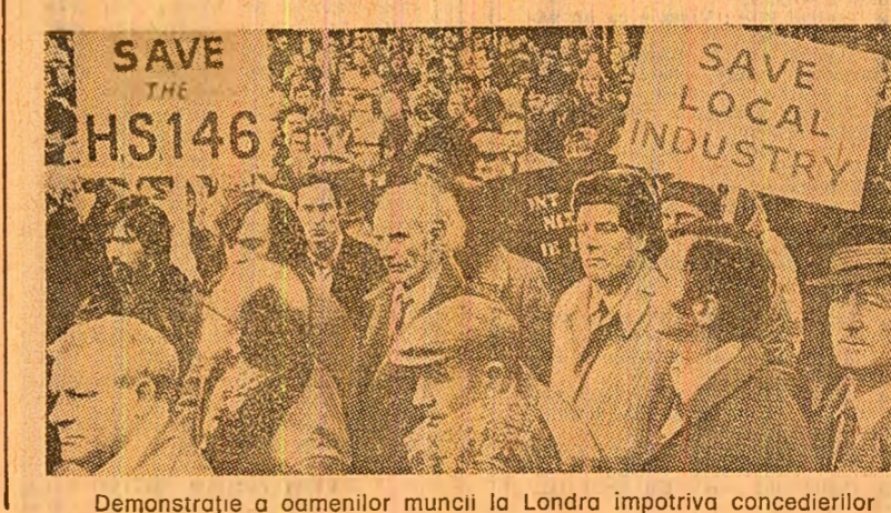
Demonstrație a oamenilor muncii la Londra împotriva concedierilor