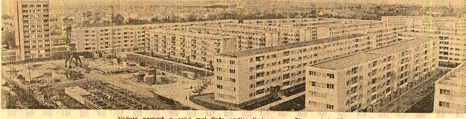
Vedere parțială a celui mai tînd cartier timișorean: „Circumvalațiunii”

Am debutat în teatrul românesc, în anul 1936. Este, cred, foarte tîrziu să scriu despre el — tot ce se înfăptuiește astăzi pentru teatrul nostru pare de necrezut.