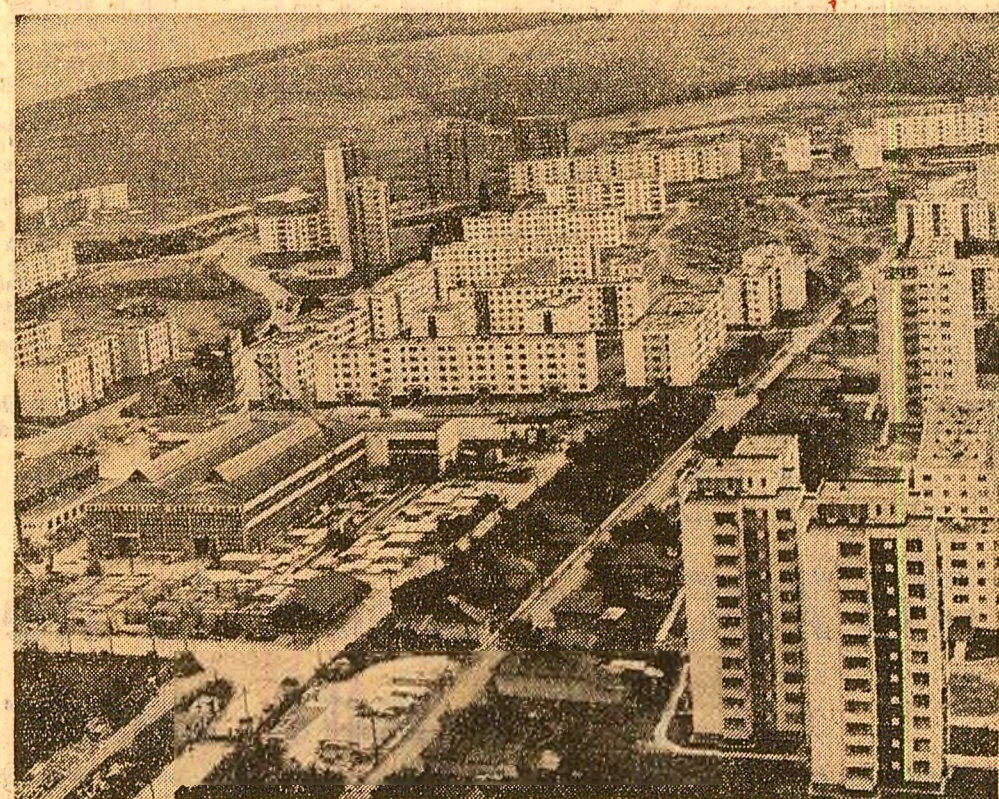
Mănăștur — cel mai tînăr cartier din municipiul Giuț-Napoca

emirului Kuwaitului, Seic Sabah Al-Salem Al-Sabah, și a doamnei Norryyah Al-Sabah, în prima jumătate a lunii aprilie 1975.