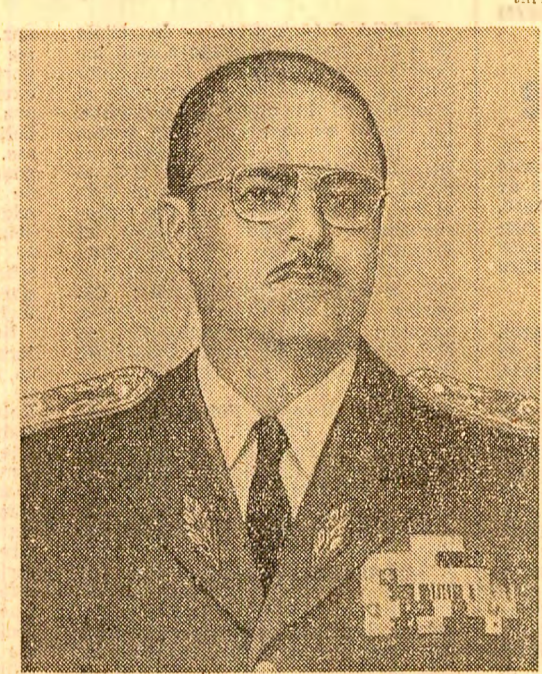
Pe plan extern, Republica Ecuador promovează o politică de afirmare a personalității naționale, de respingere a oricărui amestec din afară, de respectare a normelor de drept internațional și de condamnare a oricărui încercare de folosire a forței ca mijloc de soluționare a diferendelor dintre state. Astfel, Ecuadorul contribuie activ la afirmarea principiilor fundamentale ale lumii contemporane — colaborarea și cooperarea internațională de bază respectului independenței și suveranității fiecărei țări.

Personalitate prestigioasă a vieții politice ecuatoriene și latino-americane, Guillermo A. Rodriguez Lara a fost în anul 1923, în localitatea Pujili, provincia Cotacachi, unde a terminat și școala primară. A urmat cursurile secundare la Liceul militar „Eloy Alfaro” din Latacunga, după care și-a continuat studiile în școli superioare militare din Ecuador, Columbia și Argentina, în 1931 obținând diploma de inginer. Nouă ani mai târziu studiază la „Escuela de la America”, institut militar din zona Canalului Panama specializat în pregătirea ofițerilor superiori din țările latino-americane. Între 1932 și 1934 a îndeplinit la acest institut și funcția de profesor, în următorii doi ani urmând activitatea la Academia de război de la Fort Leavenworth, din Kansas (S.U.A.).