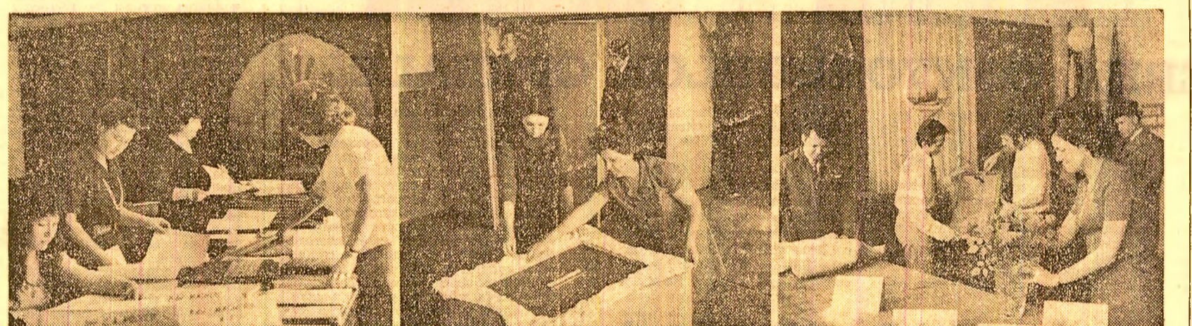
Imagini despre ultimele pregătiri pentru alegeri, realizate ieri de fotoreporterul nostru: în Capitoliu, la Consiliul popular al sectorului 1 se distribuie materialele de lucru pentru cele 56 secții de votare situate în această zonă; la liceul „Dumitru Petrescu”, elevii anului III-B amenajau secția de votare nr. 31; la secția de votare nr. 27, din sectorul 8, fuseseră aduse și florile...