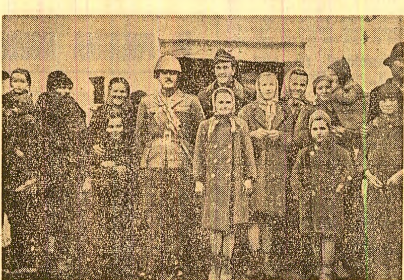
Primele zile de libertate: locuitorii ai unui sat ungar alături de ostașii români eliberatori