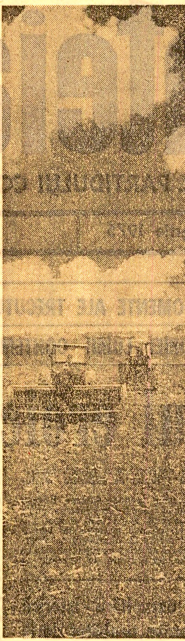
C.A.P. Remetea Mare, județul Timiș. Se seamănă ultimele suprafețe de cultură din epoca I.