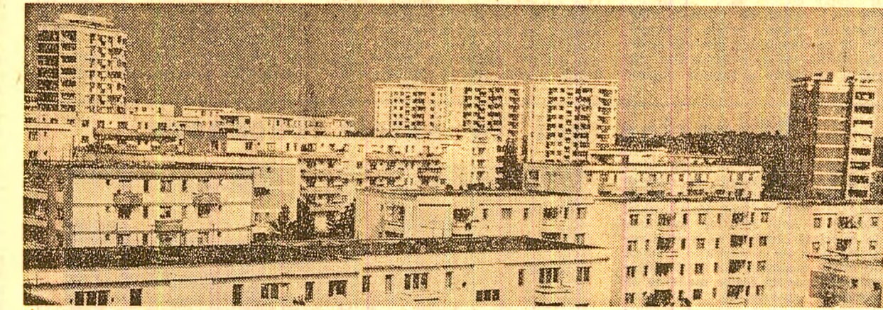
Pelsoj nou în vechea cetate a Sucevei