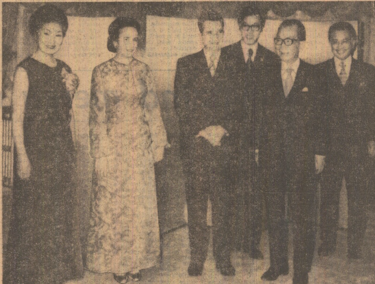
La dineul oficial oferit în cinstea președintelui Nicolae Ceaușescu și a tovarăsei Elena Ceaușescu de primul ministru Takeo Miki și soția sa, Mutsuko Miki