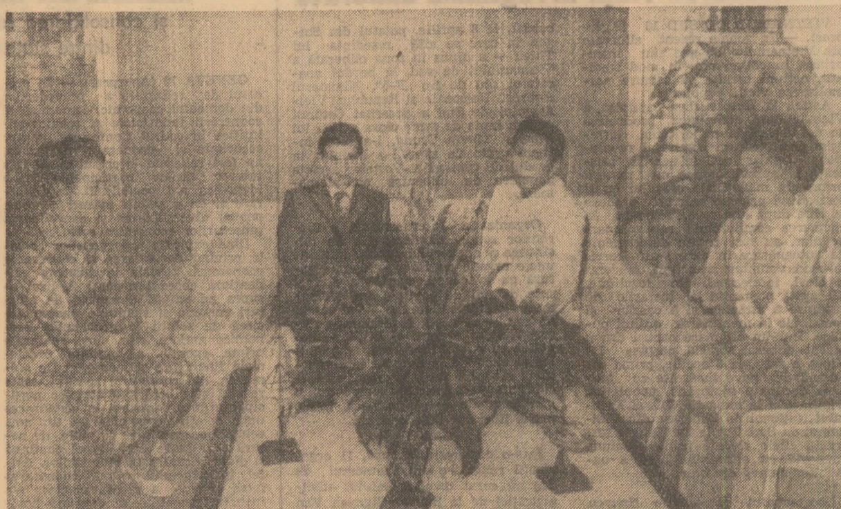
La bordul iahtului prezidențial „Ang Pangulo”, în drum spre peninsula Bataan