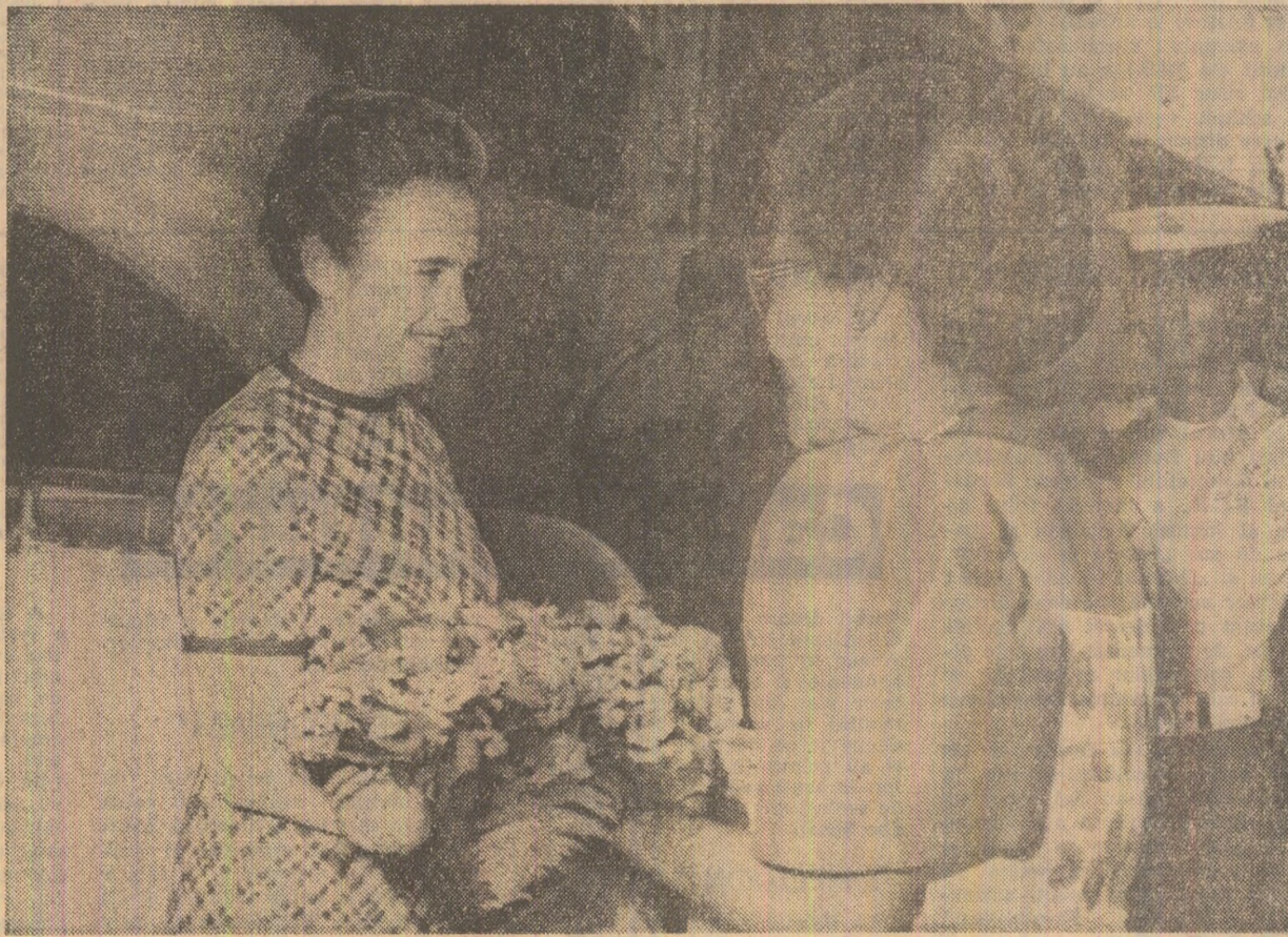
În semn de omagiu față de înălții oaspeți români, frumoase ghiioane de flori oferite, după tradiția locală, la sosirea în portul Baseko din peninsula Bataan