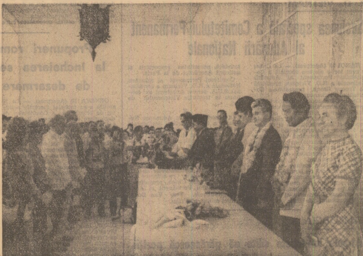
În timpul ceremoniei consacrate comemorării luptelor pentru apărarea independenței și suveranității naționale a poporului filipinez