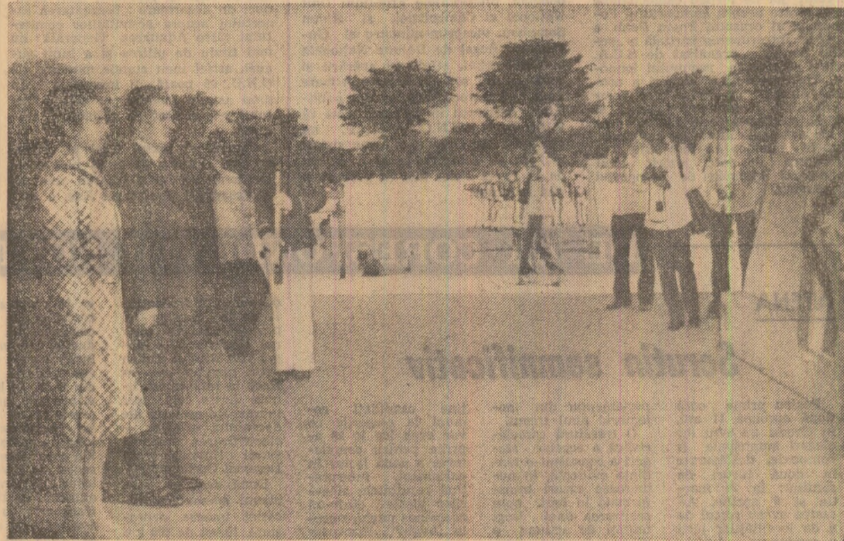
Moment solemn. Depunerea unei coroane de flori la monumentul eroului național al poporului filipinez José Rizal