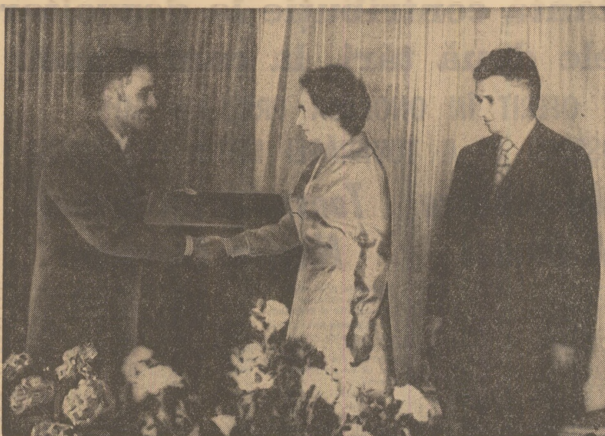
Tovarășei Elena Ceaușescu i se conferă cea mai înaltă distincție iordaniană

„Intimpinăm cu sufletul deschis și bucurie pe iluștrii oaspeți români”