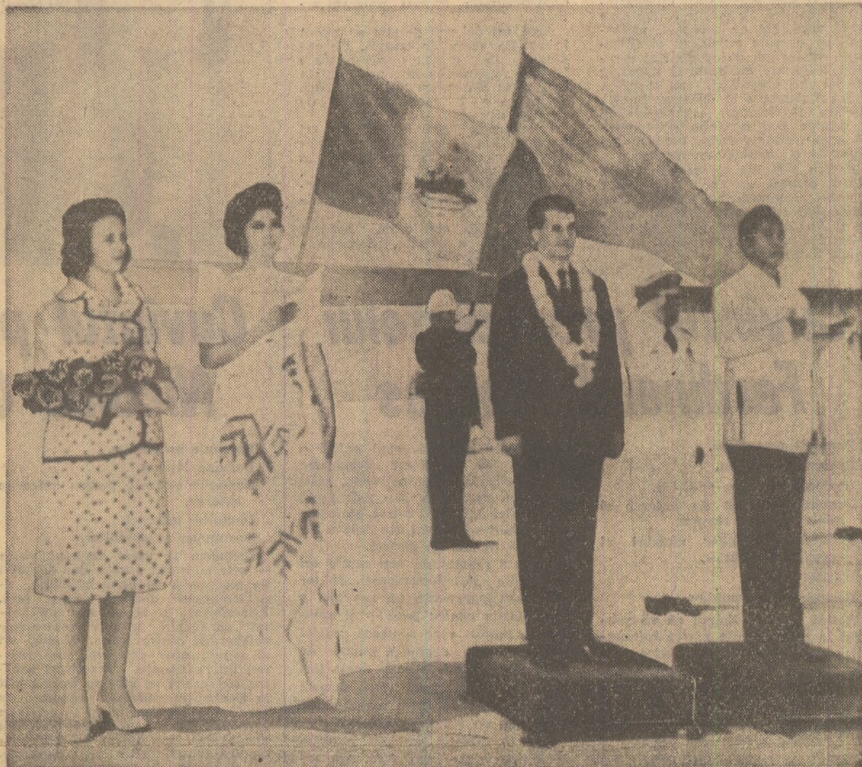
Moment solemn, înaintea plecării de pe aeroportul din Manila