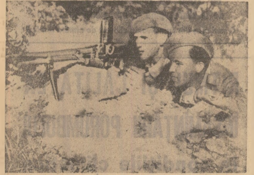
Militari români în luptele din apropierea orașului Sf. Gheorghe

ceților, care au încercat să-și mențină pozițiile cu orice preț. Cit de a-