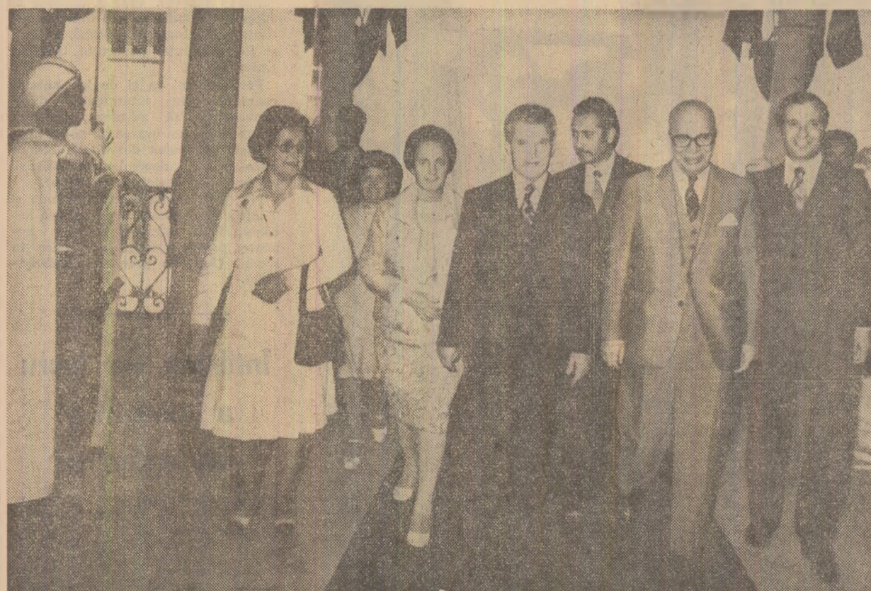
Președintele Nicolae Ceaușescu și tovarăsa Elena Ceaușescu, însoțiți de primul ministru tunisian, se îndreaptă spre sediul Adunării Naționale