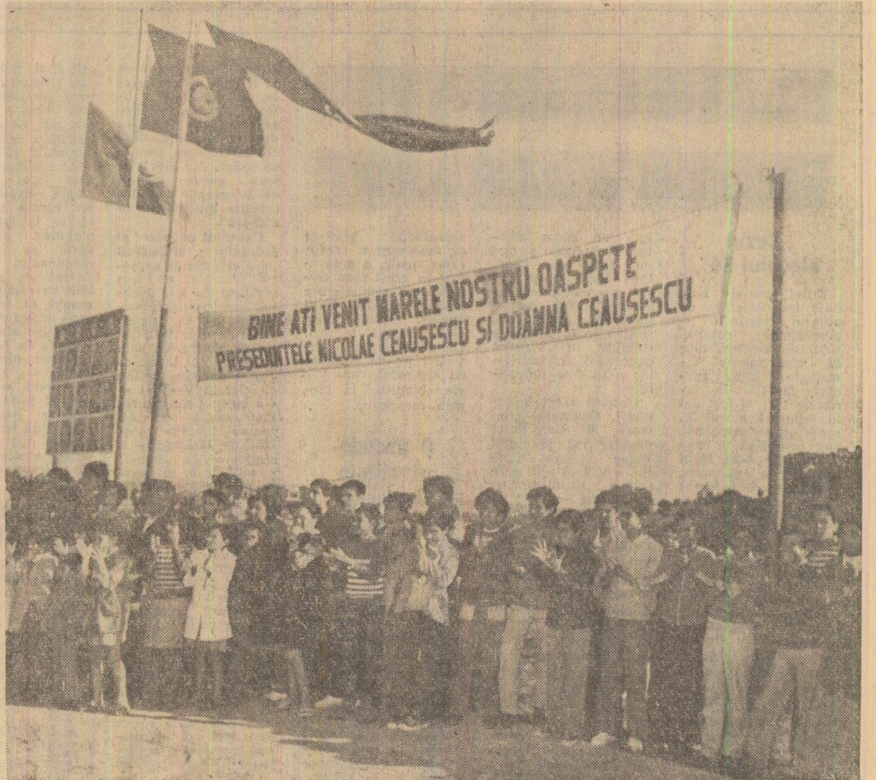
În limba română, urări pline de căldură

Înalții oaspeți urează muncitorilor și conducerii acestui complex noi succese în activitatea lor pusă în slujba progresului și înfloririi Tunisiei independente.