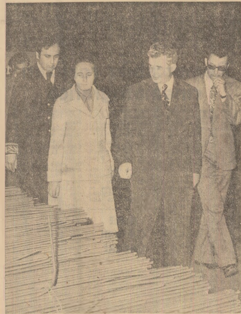
Se vizitează laminorul de la complexul siderurgic „El Fouladh”