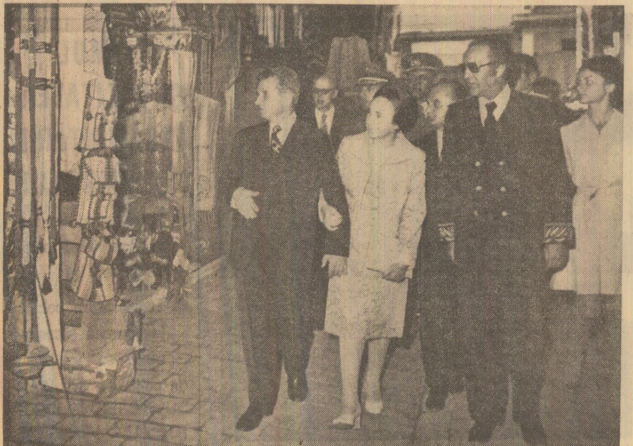
Tovarășul Nicolae Ceaușescu și tovarășa Elena Ceaușescu vizitînd bazarul din Tunisia

MEKI EL ALAOUT, secretarul general al Asociației de prietenie tunisiano-română, de curînd creată, a ținut, la rîndul său, să declare: „Imi amintesc cu deosebită plăcere de România, în care am trăit și am învățat mai multă înțelegere și simpatie pentru poporul român pe calea progresului și prosperității, sub conducerea clarvăzătoare a președintelui Ceaușescu, personalitate proeminentă a vieții internaționale, m-au impresionat puternic. Cred că experiența României poate fi un exemplu demn de urmați pentru toate popoarele care depun eforturi pentru a-și asigura bunăstarea și propășirea“.