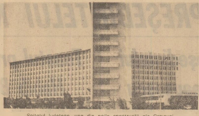
Spitalul județean, una din noile construcții ale Craiovei

Concisi, la obiect Consiliul popular orașeneș Curtea de Argeș: Pentru îmbu-