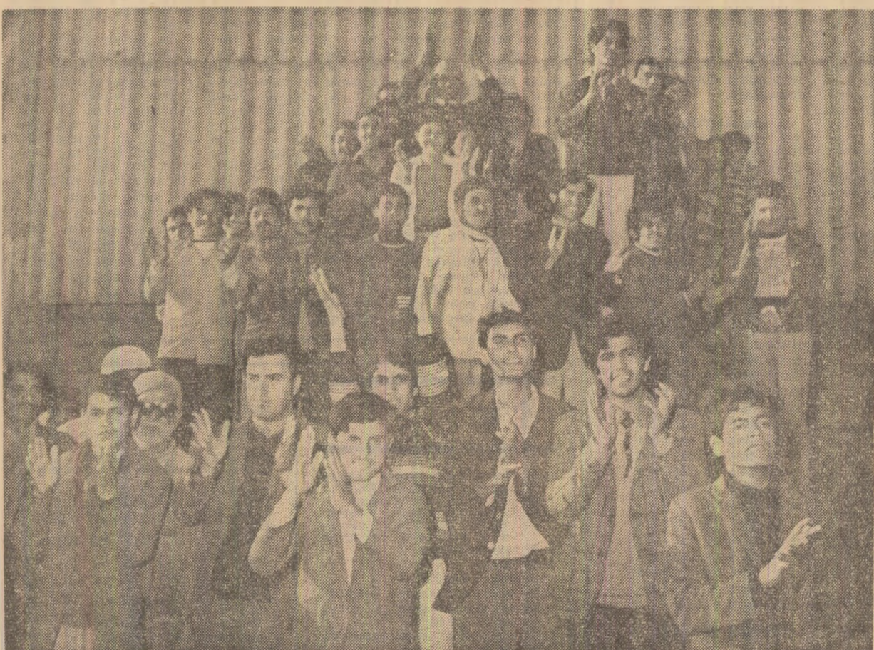
Oțelarii de la „El Fouladh” aiaamă pe solii poporului român