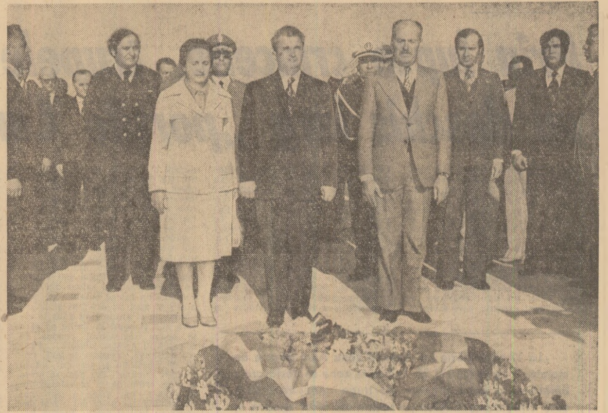
Bizerta: Solemnitatea depunerii unei coroane de flori la monumentul eroilor luptei pentru libertate și independență

Nădăduiesc că veți duce cu dumneavoastră cele mai bune impresii despre Tunisia. În orice caz, în poporul tunisian veți găsi întotdeauna un prieten. Noi vom face tot ce ne stă în putință pentru a dezvolta colaborarea, prin toate mijloacele, în interesul celor două popoare. (Aplauze).