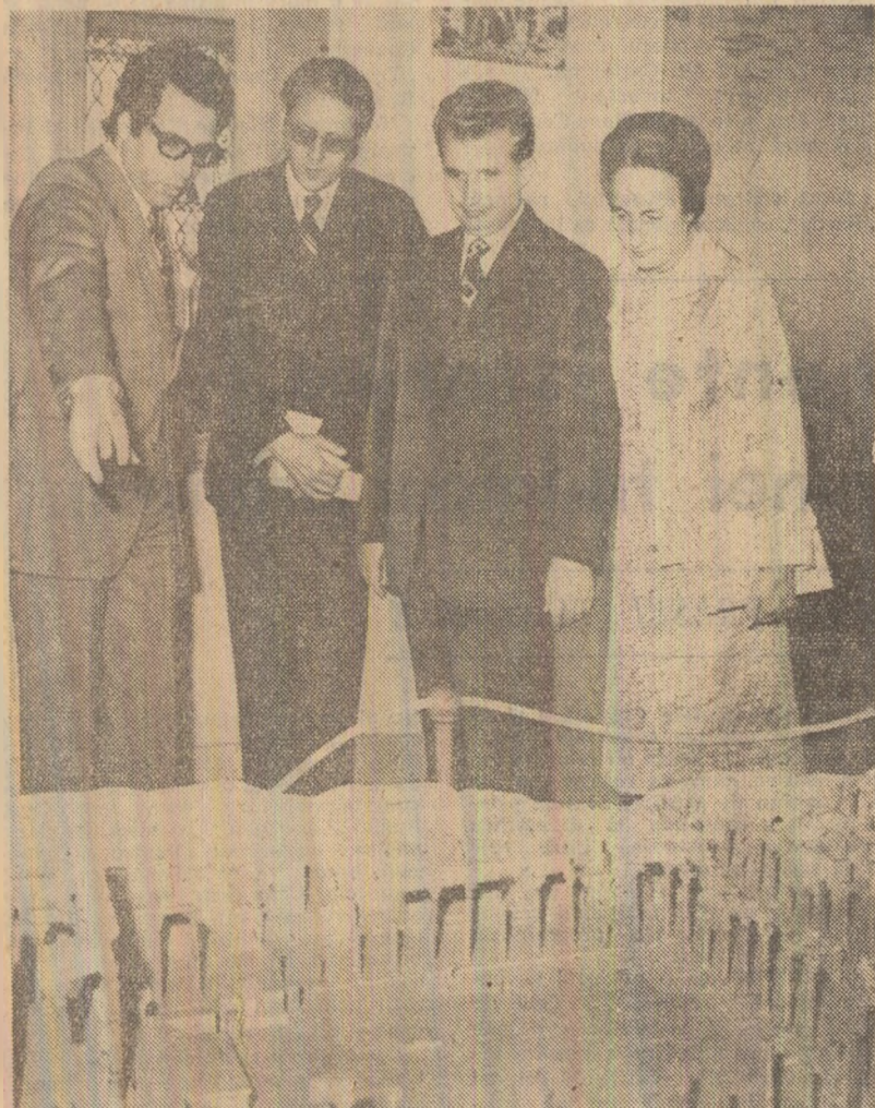
În timpul vizitei la Muzeul național