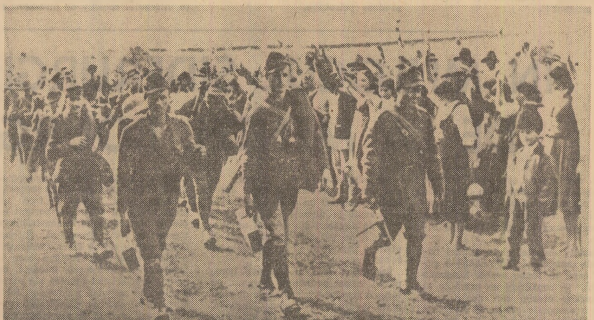
Soldații români primii cu entuziasm de populația unui sat din Transilvania