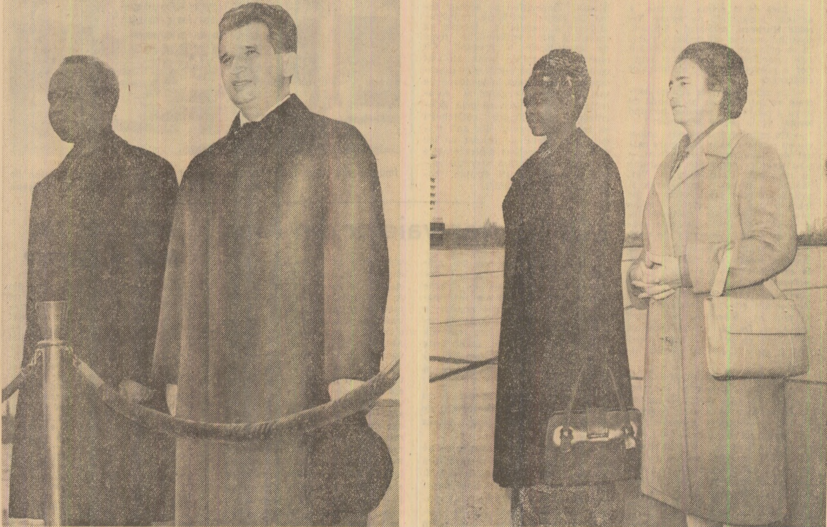
Imagini de la ceremonia primirii pe aeroportul Otopeni

De-a lungul traseului, mii de locuitori ai Capitalei, salutată cu deosebită căldură pe cei doi președinți, care răspund cu cordialitate manifestărilor de simpatie ale populației.