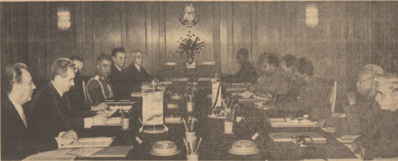
În timpul convorbirilor oficiale