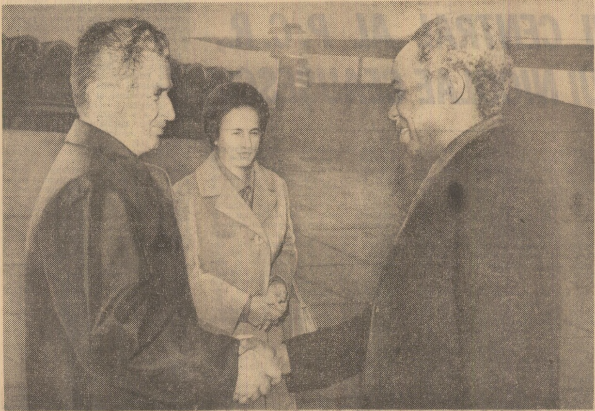
La sosire, pe aeroportul Otopeni