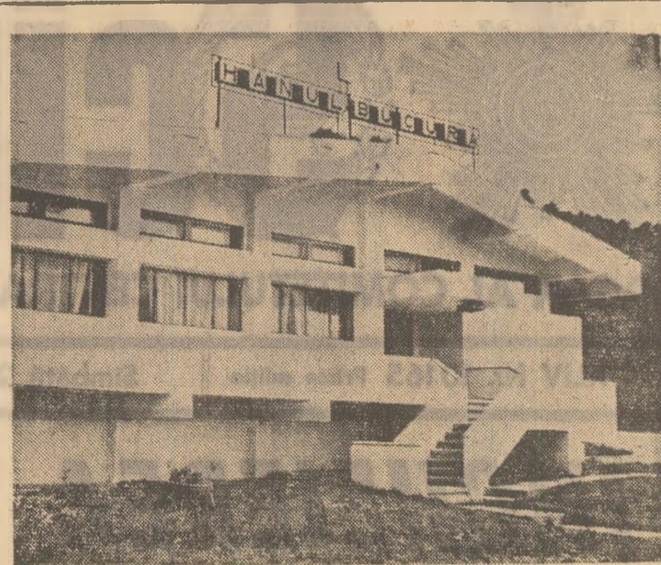
Bucura — unul din hoururile turistice ale cooperativei de consum din județul Hunedoara