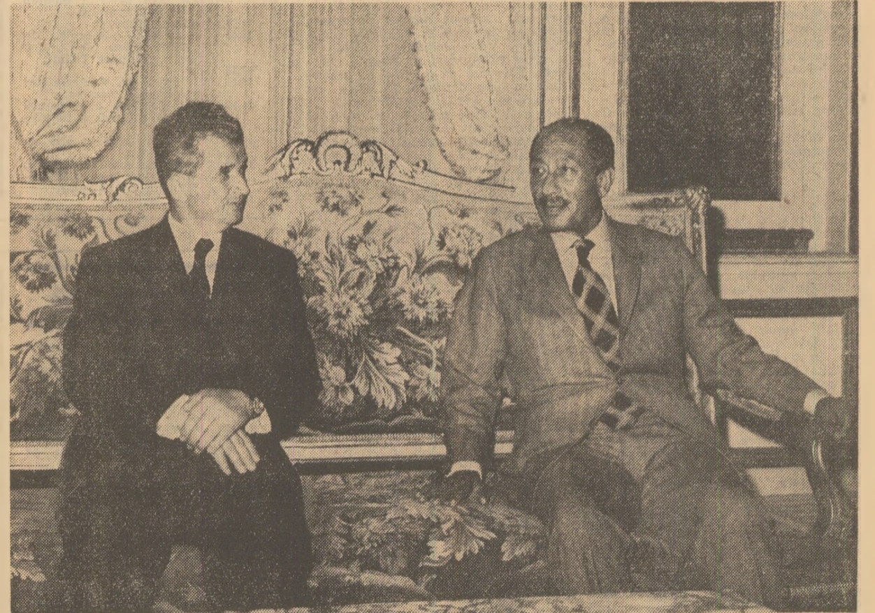
În timpul convorbirii dintre președintele Nicolae Ceaușescu și președintele Anwar El Sadat

În timpul dineului, cei doi președinți au rostit toasturi.