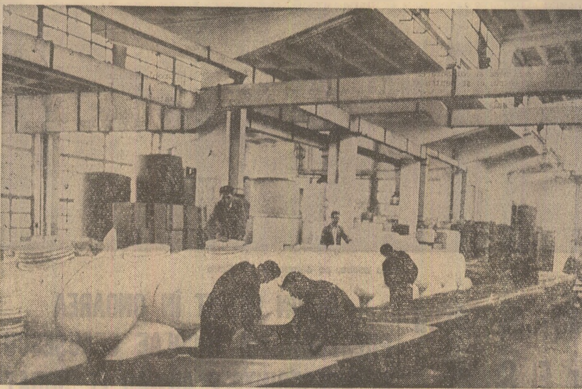
Imagine din secția sinterizare a întreprinderii de prelucrare a maselor plastice din Buzău

— Asistăm la o adevărată „explozie” a medicamentelor preparate pe bază de sinteză chimică. În lume, ele se numără cu sutele de mii. Aceste preparate medicamentose sînt deosebit de active, efectul lor asupra bolii este uneori spectaculos. Dar există și o a doua față a medaliei. Ce sînt desime efectele secundare ale acestor remedii? Căci, să nu uităm, orice substanță medicamentosă obținută pe cale de sinteză este străină organismului, aceasta fiind suprasolicitat pentru asimilarea ei. Cred, de aceea, că tre-