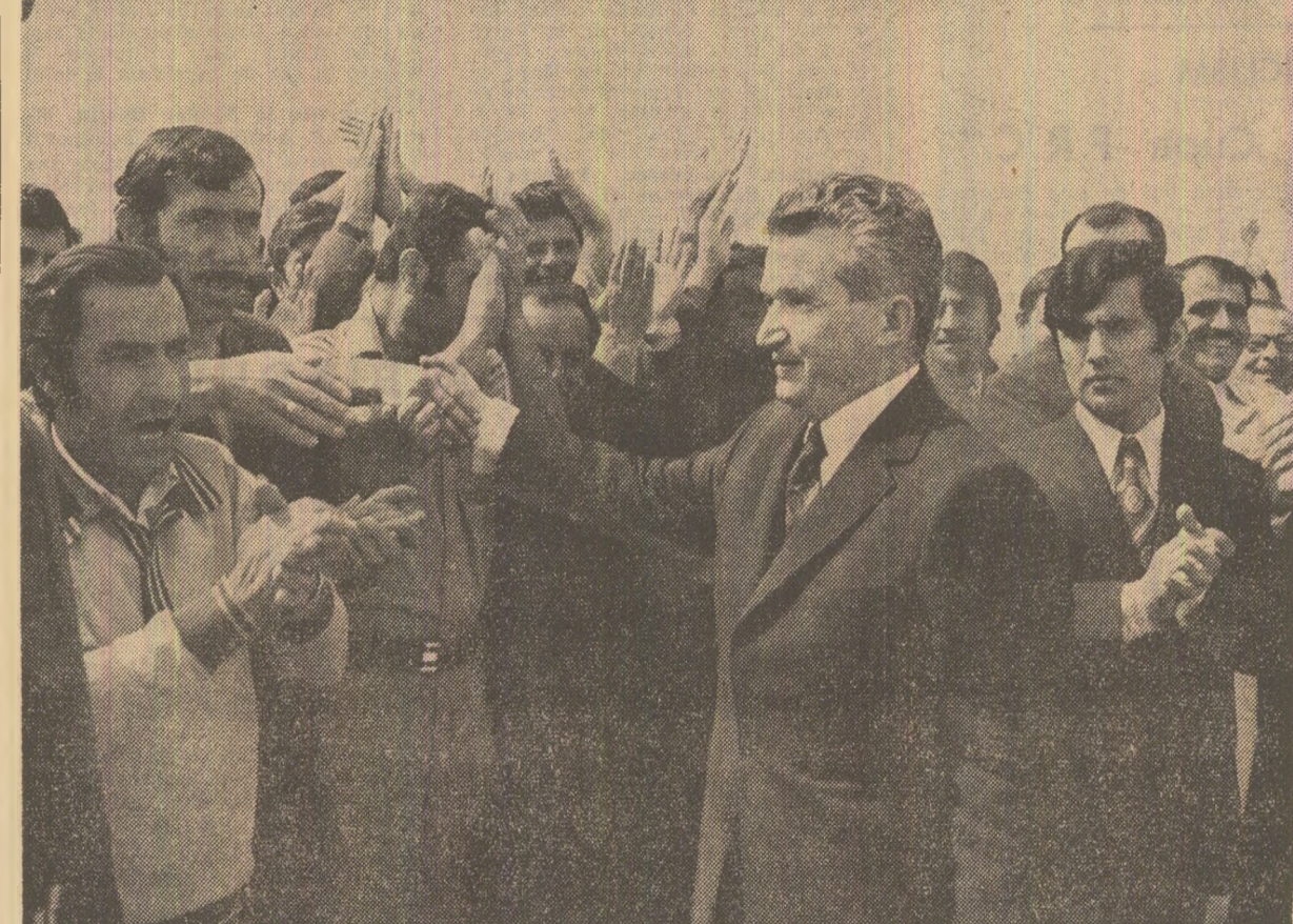
Pe aeroportul din Damasc, o caldă manifestație de simpatie și respect

Cel doi sefi de stat au constatat cu satisfacție că relațiile între cele două țări se întăresc continuu și că acordurile stabilite cu ocazia întîlnirilor lor precedente se îndeplinesc cu succes.