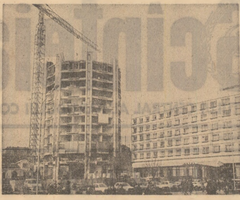
Se înalță o nouă anexă a hotelului turistic din Pitești