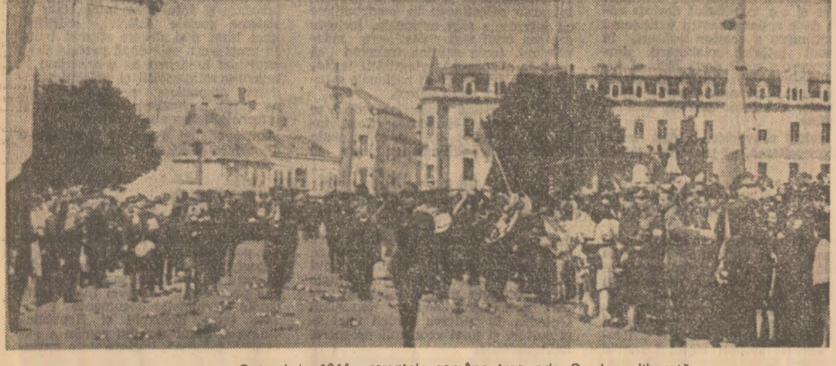
Octombrie 1944: armatele române trec prin Oradea eliberată

(Din Ordinul de zi al ministrului de război român, 26 octombrie 1944).