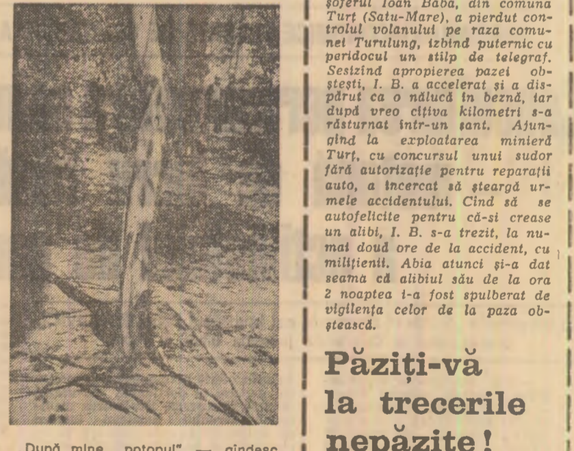
„După mine... potopul” — gîndesc „oaspeții” nedorii ai pădurii

„Linia 48, stația „Grădina zoologică”. Din autobuz coborâi un grup mare și vesel: probabil mama, tata, bunica, nepoții. Copiii se simt în largul lor. Alenargă, rid, se hărjoase. Doar cei mari se uită mai atent în jur: totuși, spintecat, cit de lung, de un șant, de-o parte și de alta a drumului...”