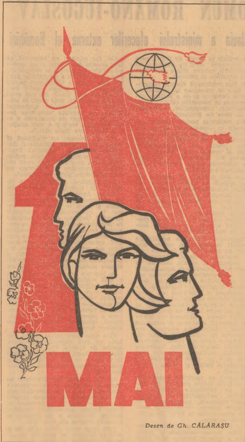
Desen de Gh. CALĂRAȘU