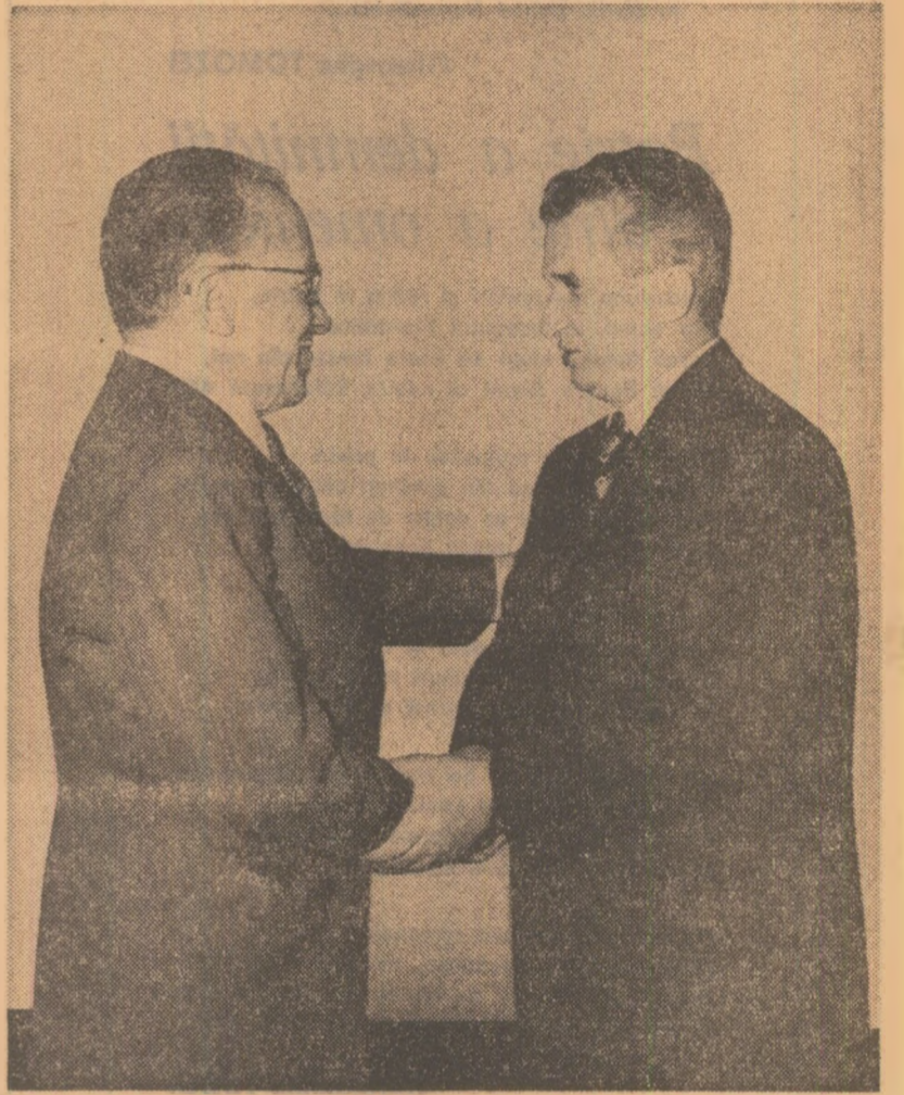
atmosferă de caldă prietenie, înțelegere reciprocă și cordialitate, în spiritul relațiilor statornicite între cele două partide, între conducerile lor.