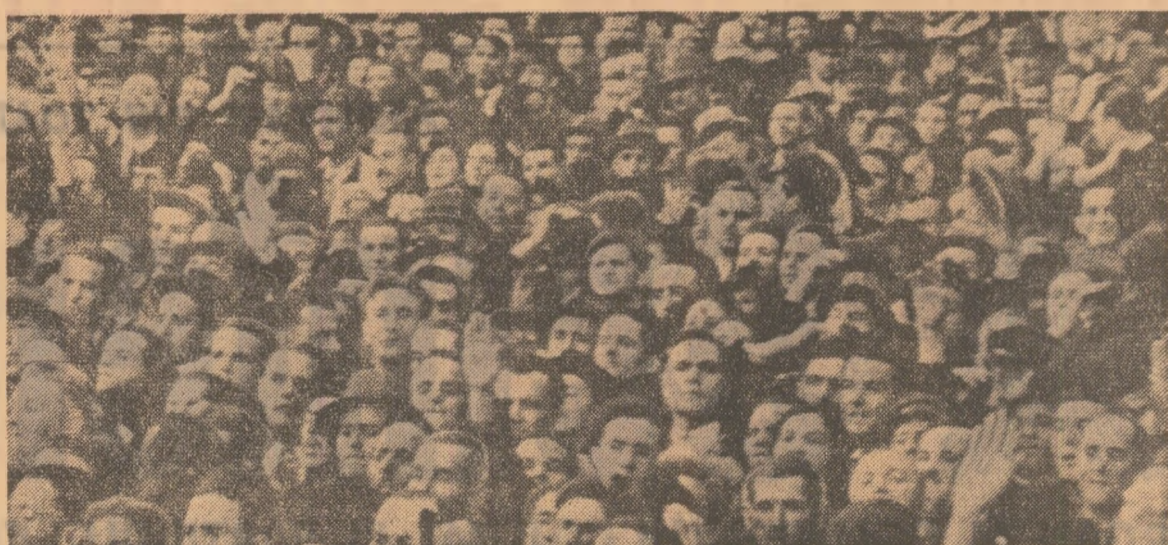
1 Mai 1939: În timpul marilor demonstrații antihitleriste din Capitală

— Un fapt cu care ne mîndrim toți pe plaiurile comunei noastre: zămlisirea, pe sute de hectare de dealuri sterpe și erodate, a celei mai frumoase și mîndre plantații viticole din județ. Această via atînge pînă în anul 1980 la circa 1 500 hectare cu viță nobilă. Dar, dincolo de nărmirea viitoare podgorii, dincolo de avantajele economice, mai este ceva: nu mai puțin de 100 de cooperative agricole din județ