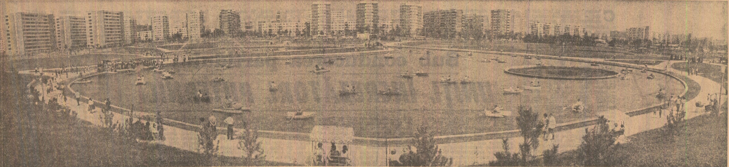
O „perla” adăugată saibei de lacuri bucureștene: locul de agrement împlîntat în inima noului cartier „Drumul Taberei”

Ilie TANASACHE și corespondenții „Scintei”