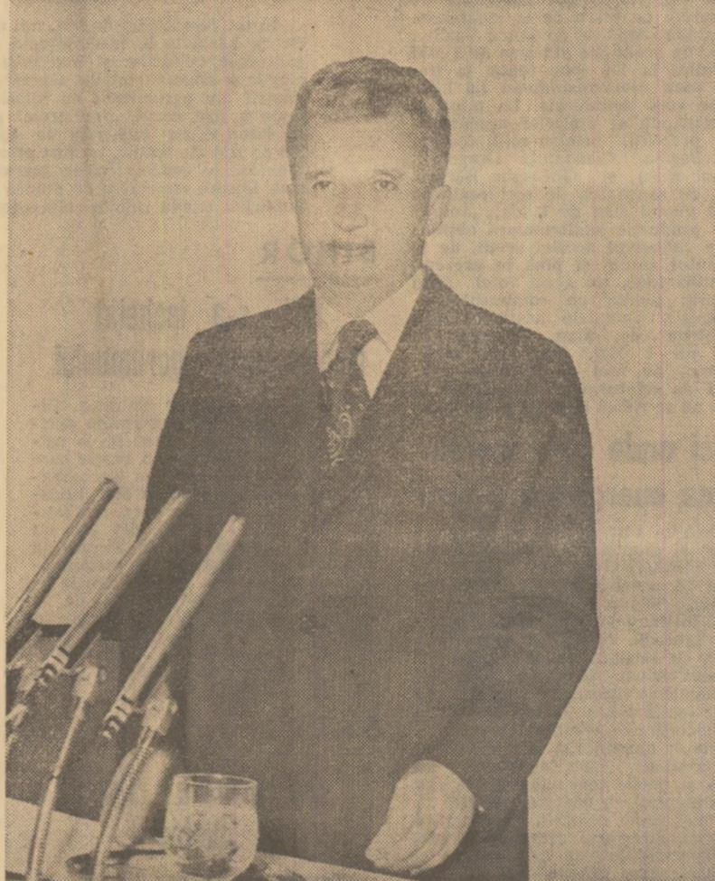
Fotografie de Nicolae Ceaușescu.

Secretar general al Partidului Comunist Român, Președintele Republicii Socialiste România