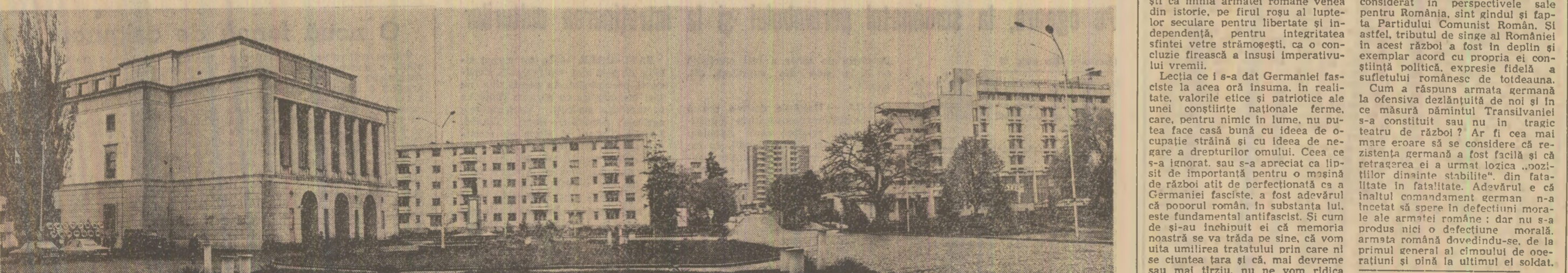
Botoșani, oraș vechi? Doar copaci din acest centru civic numără decenii