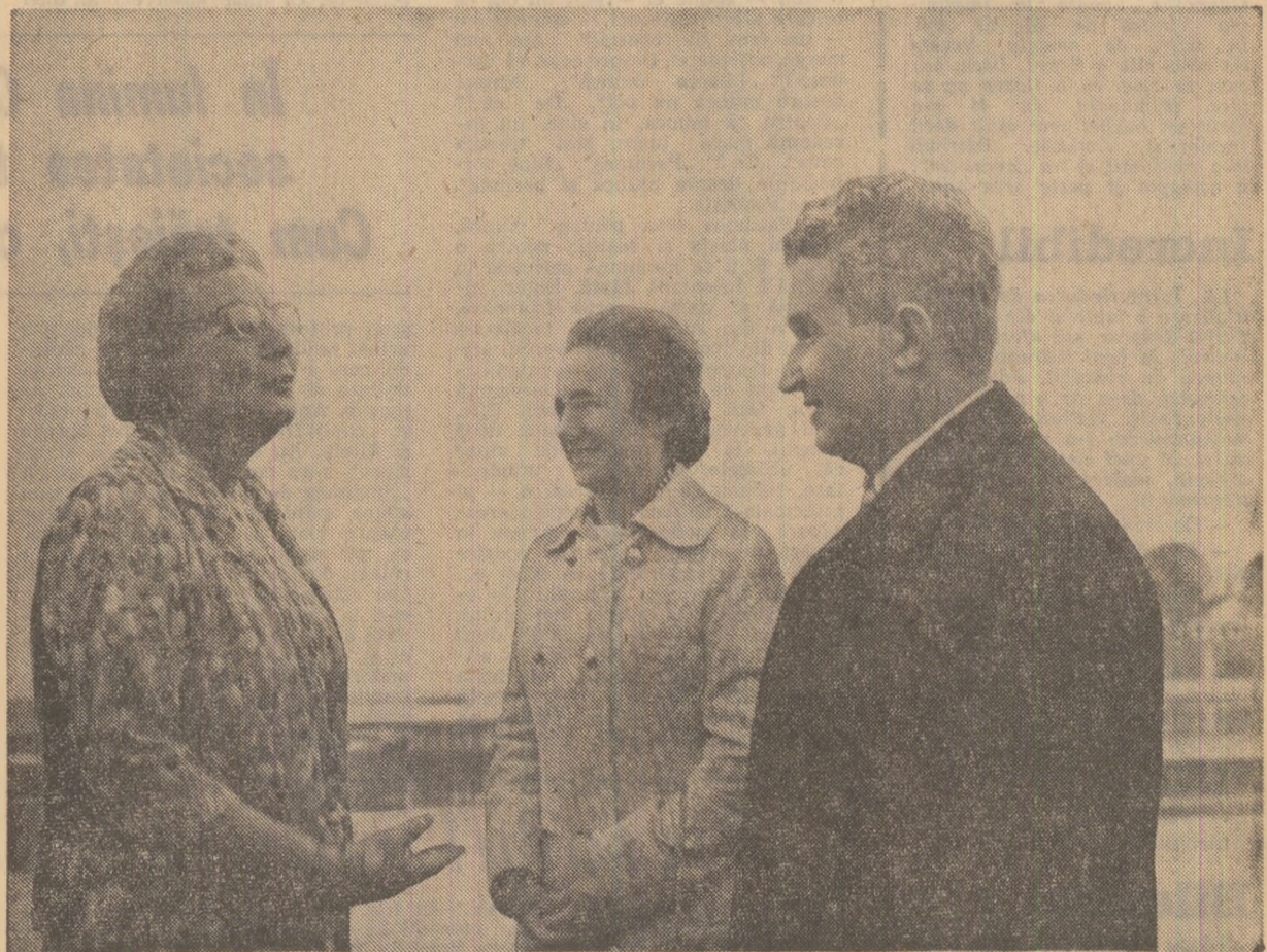
La plecare, pe aeroportul Otopeni

Convorbirile purtate și acordurile încheiate — o nouă și importantă contribuție la dezvoltarea prieteniei și colaborării româno-olandeze, în interesul reciproc, al păcii și securității în Europa și în lume