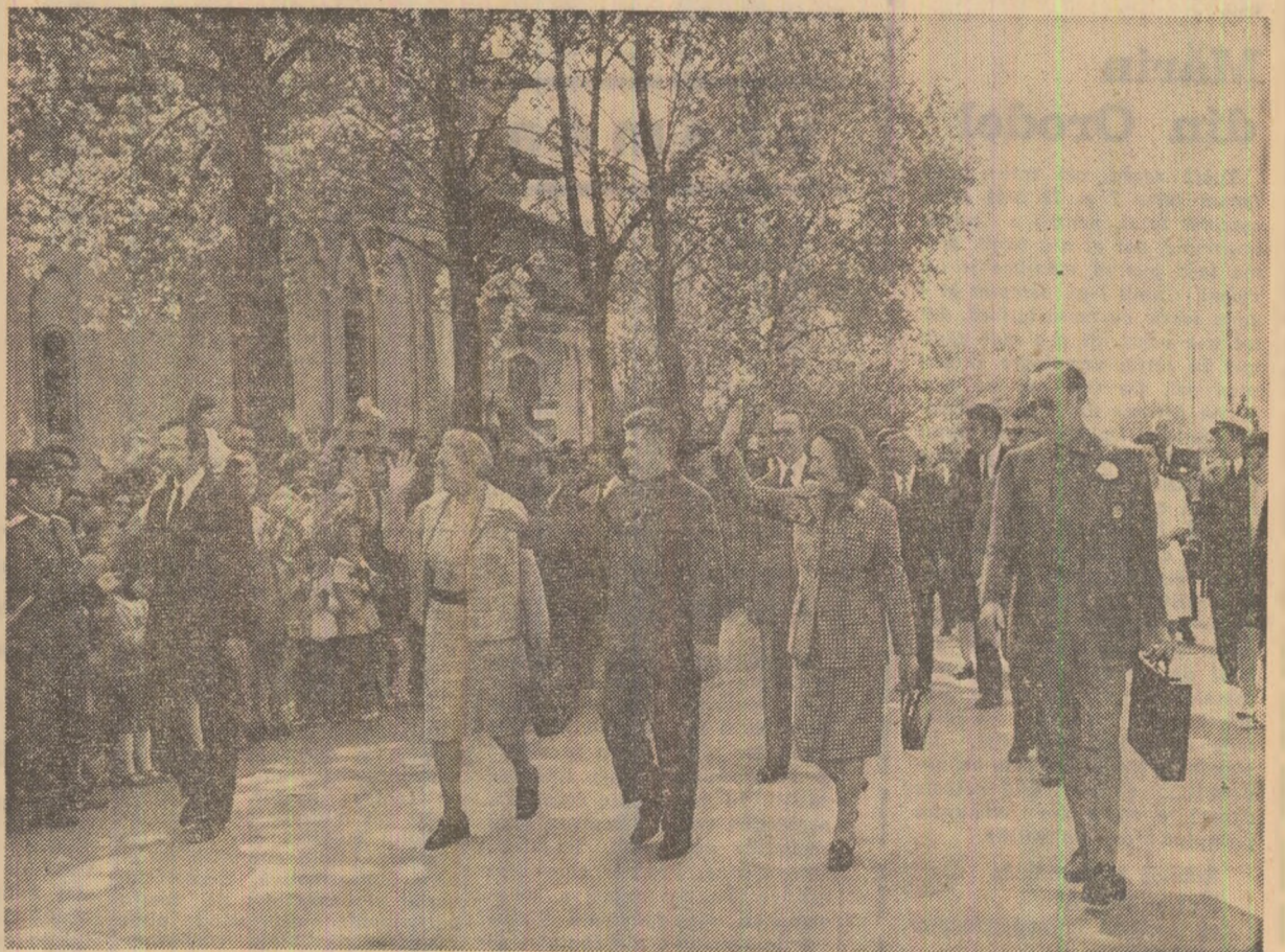
La Sulina, mil de locuitori salută cu vîl și îndelungi aplauze pe înalții oaspeți